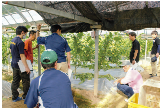
現地で観察して質問したり生産者同士の交流の場にもなりました。