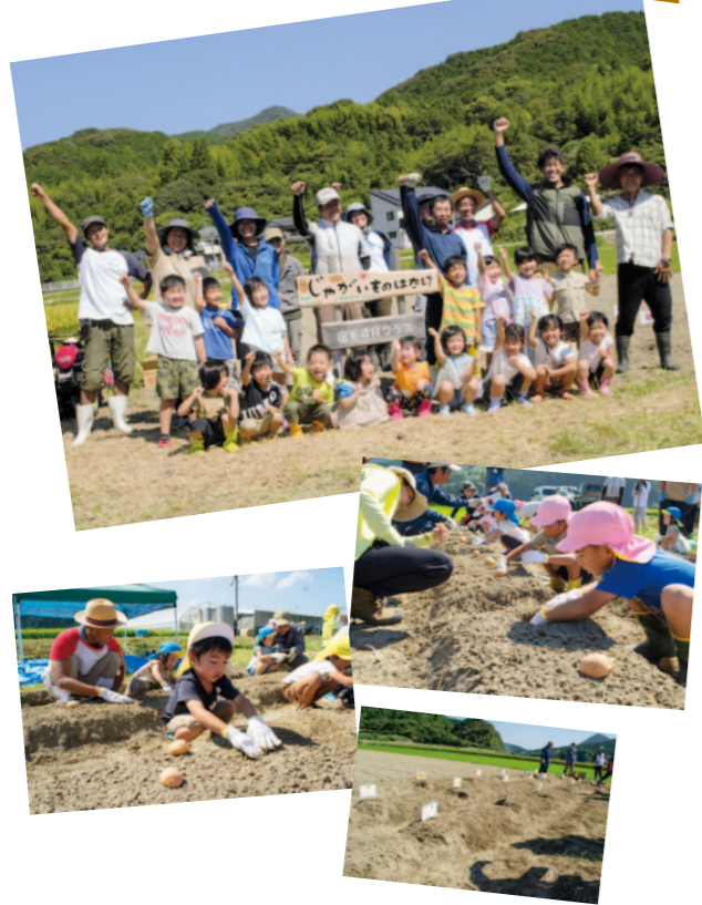
宿毛支所管内より