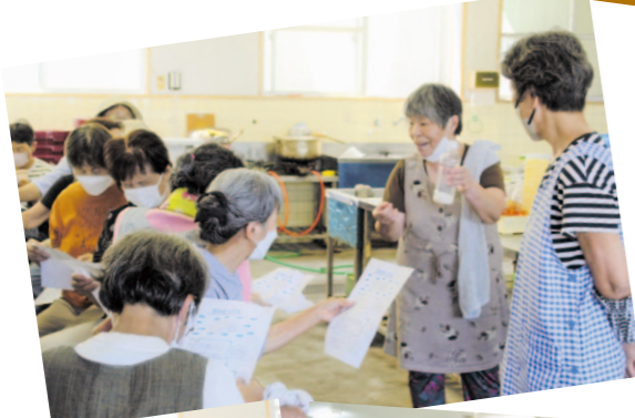
大方支所管内より