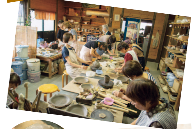
幡多地区管内より