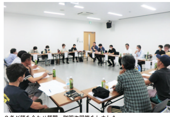
3者が顔を合わせ質問、説明や回答をしました。

幡多地区は9月13日、青壮年部、女性部、J A三者による意見交換会を開きました。この会は、J Aに対する意見や要望を各支部長らに取りまとめ、直接伝える場であり同地区で毎年開かれています。女性部からは消費者の立場から、同地区管内で発生した農薬の誤使用について、今後の対応を含めた詳しい説明を求めました。青壮年部は「異常気象が続く中、各品目それぞれに対応した新しい品種を作ることが急務ではないか」や「自治体やJ Aなど農業分野全般の課題解決へむけた協議に農業者も含めるべき。自分たちも一緒に対策を考えていきたい」、「新しい農薬の使い方などメーカーを現地に呼んで勉強会や講習会をもっと開いてほしい」などの要望を出しました。