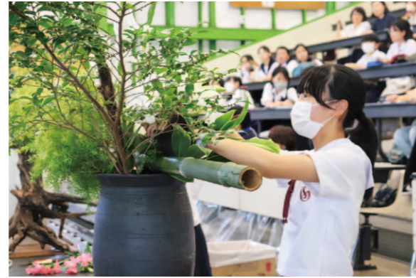
真剣に花を生ける高校生

高知県とJAグループ高知で構成する高知県園芸品販売拡大協議会は9月8日、「高校生花いけバトル」の3回目の練習会を高知市内で開き、県内の中高生34人が参加しました。幅広い世代に県産花きを知ってもらい、花に触れる機会を創出することで県産花の需要拡大を目指しています。 練習会では、同協議会がグロリオサやユリなど、県産花を含む約50種類の花材を提供。競技のルールや完成した作品のフィードバックなどを行いました。四国大会は翌年1月12日に愛媛県今治市で開催される予定です。