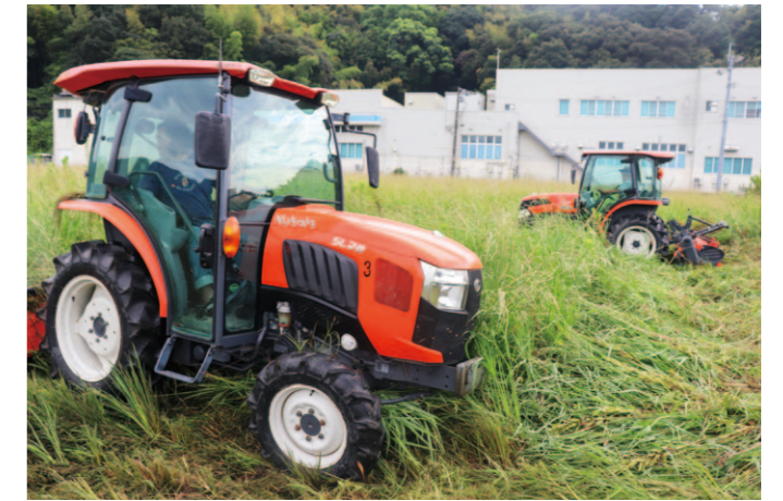
トラクターで圃場を復元