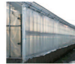
外張り被覆をスプリングやマイカ線で固定