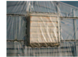
換気扇のシャッターを目張り