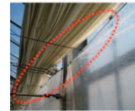
天井カーテンと側面カーテンのつなぎ目