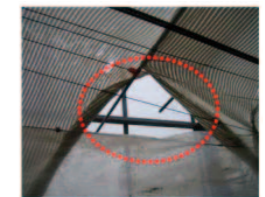
天井カーテンの隙間 (裏面)