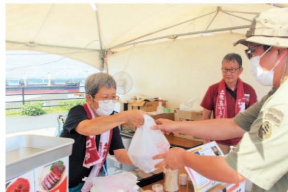
食肉センターのローストビーフを購入する来場者 写真⑤

（株）高知県食肉センターと県内のクラフトビールメーカー「SOUTH HORIZON BREWING」は9月15、16日の両日、高知市で「肉食麦飲2024」を開きました。県内の畜産物販売者1店舗と醸造クラフトビールメーカー4店舗が出店。来場者約3000人が「土佐あかうし」や「土佐黒牛」などとクラフトビールを堪能しました。 同センターは国産牛のローストビーフを提供。イベント開始から列ができるなど人気を集めました。市内から訪れた男性は「お肉もクラフトビールもおいしくて楽しめた。家族で来てよかった」と話しました。