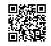
ニラの生春巻き レシピ

さんが夏にびつたりの火を使わずに簡単に作れる「ニラの生春巻き」を調理してくれました。 今回の収録の様子は6月15日に放送され、香美地区のニラを四国内の方に知っていただく機会になりました。紹介した「ニラの生春巻き」のレシピはJAH高知県のホームページでも公開されていますので是非ご覧ください。