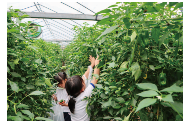
たくさんのピーマンを収穫しました。