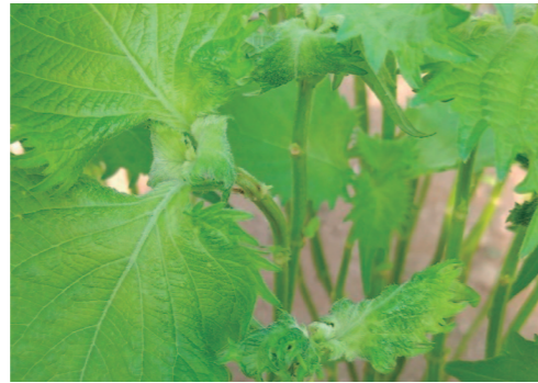
被害症状(新葉の縮れ)