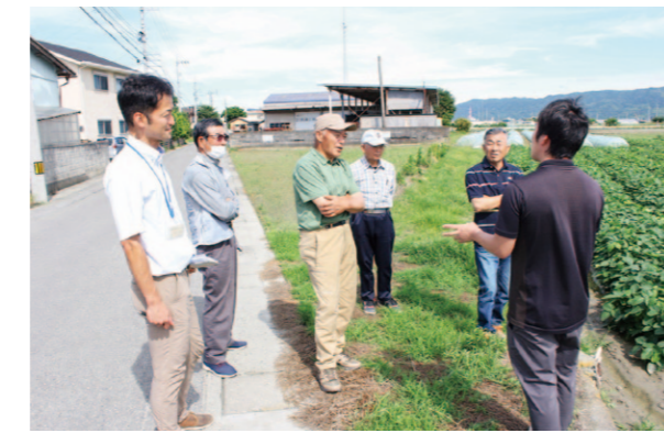
ほ場を見学しています。

6月21日、枝豆研究会はJA徳島市への先進地視察を行い、生産者4人が参加しました。現地では枝豆選別施設の見学とJA徳島市の枝豆の取り組みや概要を受けました。その後、枝豆の栽培ほ場へ移動し現地の栽培方法について教わりました。生産者は初めて見る設備や栽培方法に目を輝かせながら質問しており、より一層枝豆に対する熱意と栽培技術の向上が図られる有意義な視察研修となりました。