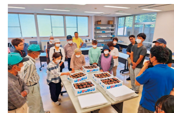
出荷規格について説明を行っています。

6月21日、津野山みょうが部会は出荷目慣らし会を行いました。当日は生産者、出荷場共選員、農業振興センター等32名の参加があり、トレーの詰め方のいい例・悪い例や色味・形状の良し悪し等の規格の目合わせを行い、今後の本格的な出荷の前に関係者の意識共有ができました。また、農業振興センターより熱中症についての対策等の情報提供・JAより燃油高騰対策事業、今後の共操作業について説明を行いました。津野山地域のミョウガの収穫は11月末日ごろまで続く予定です。