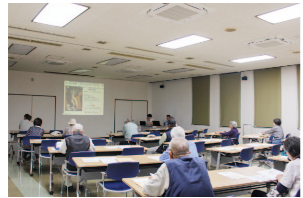
農業の取り扱いに注意しましょう。

6月6日、JA高知県みどり市野菜栽培講習会を行い、午前・午後の部合わせて21人が参加しました。秋冬野菜の栽培や、農薬の安全使用について説明されました。農薬の安全使用については、事故を防ぐためにも散布器具等の洗浄を十分に行うことや、残薬液・洗浄水の処理は適正に行うことなど、扱う際に必ず注意しなければならぬ点について参加者は聞き入っていました。農薬の扱いは、出荷やその後の生産に大きく関わるので、この講習を通して、改めて注意しながら扱っていきます。