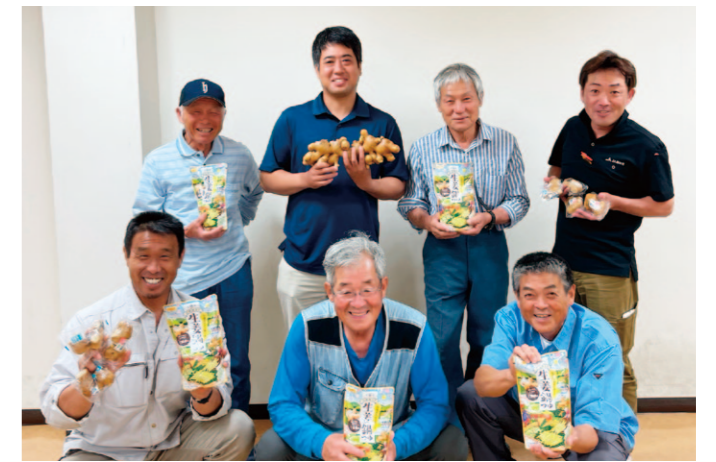
「生姜を食べる生姜鍋つゆ」みんな、食べてや！

6月21日、津野山みょうが部会は出荷目慣らし会を行いました。当日は生産者、出荷場共選員、農業振興センター等32名の参加があり、トレーの詰め方のいい例・悪い例や色味・形状の良し悪し等の規格の目合わせを行い、今後の本格的な出荷の前に関係者の意識共有ができました。また、農業振興センターより熱中症についての対策等の情報提供・JAより燃油高騰対策事業、今後の共操作業について説明を行いました。津野山地域のミョウガの収穫は11月末日ごろまで続く予定です。