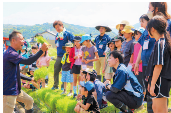
職員から苗の植え付け方法を学ぶ児童ら

JA高知県安芸地区は5月25日子どもたちが地域の農家とのふれあいや農業体験などを通して食と農に触れる「第19期やっばり農！いきいきちゃぐりん塾」を開校しました。 今年も、管内7小学校から32人が参加し、児童が苗をひとつひとつ丁寧に木枠を使って手で植えていきました。児童は、「田植えが楽しかった」と笑顔を見せました。秋には児童たちがカマを使って稲刈りを行う予定です。初回は、田植えの他にあき支所前の花壇に花植えを行い、ライスセンターでサツマイモを植えました。ちゃぐりん塾は全8回開催される予定です。