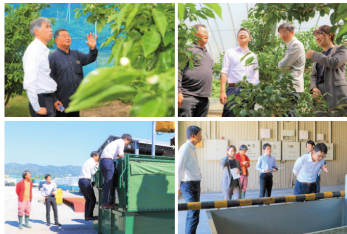
開花調査や加工場見学をしながら交流する様子