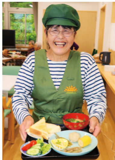
旬の地元野菜をふんだんに使ったモーニング

営業日 毎月1回限定 営業時間 8:00~12:00 メニュー モーニングセット (旬の食材プレート・パン・コーヒー・デザート等) お問い合わせ 0887-25-3777 (集落活動センター ひなたぼっこ)