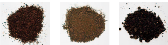
写真1 牛ふん堆肥 オガクズ堆肥

地温によって堆肥の分解具合が変わるので、分からないことがあれば安芸農業振興センターまでご相談ください。