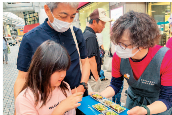
ナス料理をふるまう部員

高知市内の帯屋町にある大丸前で、5月12日に行われた「JA高知県グループフェア」にJA高知県安芸地区消費拡大連絡協議会が参加し、県産ナスや野菜の消費宣伝を行いました。試食コーナーを設けて「なすのたたき」「なすとみょうがのごま和え」「なすピザ」を振る舞い、レシピを配りながら紹介しました。生産者が来店者に高知なすを使った試食メニューを提供するなどしておいしさをPRしました。 JA高知県グループフェアでは他にも春野地区のミョウガやシヨウガ、大葉などの販売がありました。