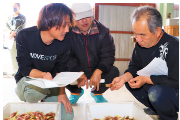
A品のミョウガの大きさや色付きを確認する生産者ら

J A高知県安芸地区安芸支部園芸部園芸研究会は4月2日、安芸市にある安芸集出荷場で目慣らし会を開きました。同市の生産者やJA、安芸農業振興センターの職員が集まり、今作の選果規格や意見交換、予約取引計画、販売推移などを共有しました。生産者らは、A品のミョウガの大きさや色付きなどを確かめ、目安を確かめました。