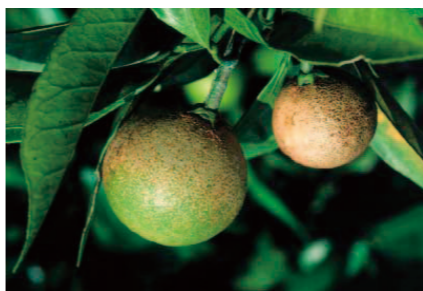
ミカンサビダニによる果実の被害

黒点病はカンキツ病害の中で最も 多く発生し、被害の大きい病害です。 被害果は病菌密度で症状が異なり、 黒点型、涙斑型、泥塊型となります。 防除対策としては生育期を通して枯 れ枝を除去すること、適期に薬剤散 布する事が重要です。ジマンダイセン 水和剤を使用する場合の防除時期は 梅雨入り前に1回、その後は200、 250ミリの降雨後毎に散布します。 梅雨明け以降も後期感染防止の薬剤 散布を随時行なう下さい。 かような病は枝葉の病斑で越冬し 春先から降雨によって伝染します。伝