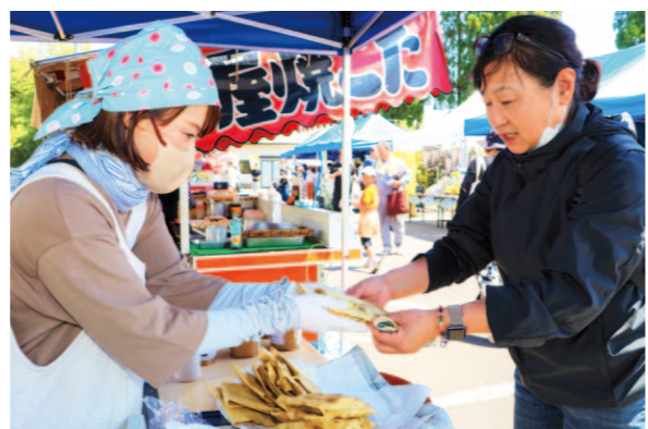
ジャコ天を買い求める来場客

J A高知県安芸地区安芸支部「なすっこ組」は4月14日に安芸市で開かれた「第31回手づくり登り窯フェスタインつじ祭り」でナス商品をPRしました。TVや新聞に取り上げられたこともある「なすぶうの餃子」50パックと「なすのたたき」18パックは販売開始1時間足らずで完売となる人気ぶりでした。