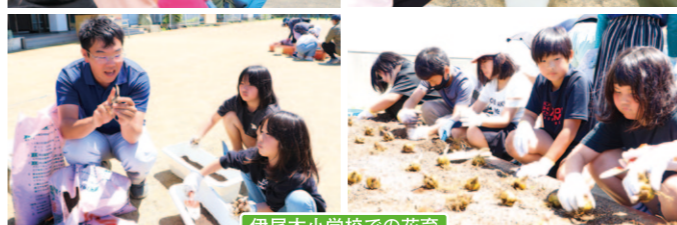
伊尾木小学校での花育