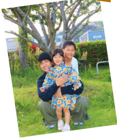
あき支所管内より