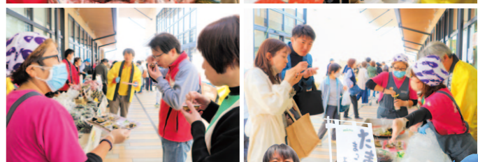
「なすのたたき」の試食宣伝や特産品を販売する部員ら