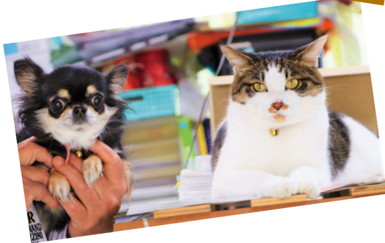
室戸支所管内より