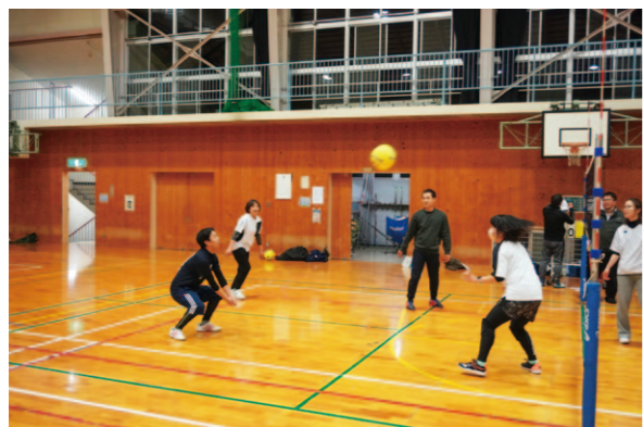
全力プレーで汗を流したソフトバレーボール大会

J A高知県女性部れいほく地区は3月27日、本山町でソフトバレーボール大会を開き全力のプレーで交流を深めました。同部では、部員やフレッシュミズ部会、青壮年部との親睦を深めようと毎年ソフトバレーボール大会を開催。5年ぶりとなった今年は20人が参加し、汗を流しました。 試合は1チーム5人の総当たり形式で行われ、一球ごとにチーム内で声を掛け合いながら熱戦を展開。全4チームで勝敗を競い合いました。参加者は「久しぶりの開催だったけど意外と盛り上がった」「楽しくプレーすることができた」と笑顔で話しました。