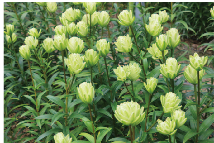
4月上旬より出荷が始まった「ノーブルアイカ」