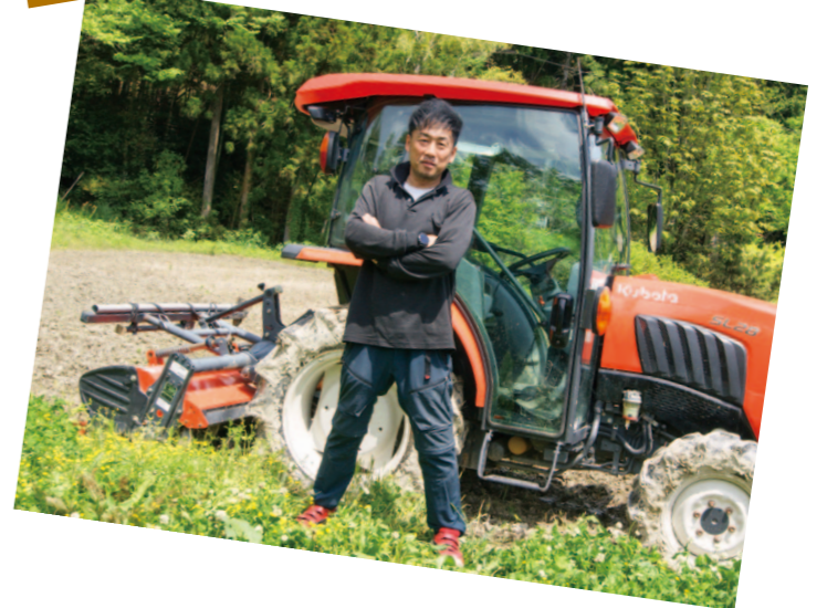
れいほく支所管内より

兼業農家として農業に従事する傍ら、地元の消防団に加入している睦さん。訓練や行事に参加し、団員との交流を深めながら精力的に活動。地域活性化を請け負う農業者として今後の活躍に期待がかかります。