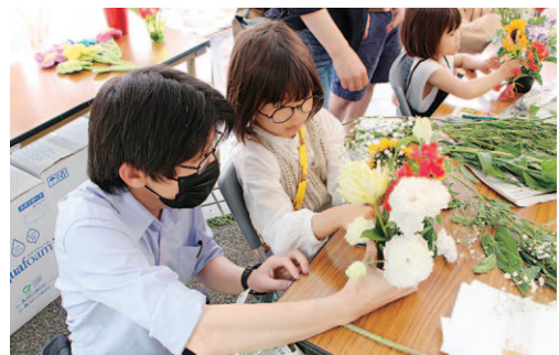
県産花のアレンジメントを楽しむ子ども

会場内には県産花を使った切り花ブースが設けられ、写真を撮ったり眺めたりと県産花の魅力を味わう来場者で溢れていました。