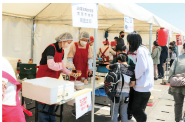
多くの来店客でにぎわったJA高知病院まつり

J A高知厚生連は4月14日、南国市のJA高知病院で「第17回JA高知病院まつり」を開きました。イベントでは、医師らによる体脂肪や骨密度の無料健康チェックや子ども向けの手術体験など、病院ならではの催し物を通じて地域住民との交流を深めました。 管内からは南国市地区の女性部・三和支部と岡豊支部、れいほく地区の目的別グループ「米粉倶楽部」が焼きそばやたこ焼き、米粉うどんなどを販売。JA高知県の直販所「かさぐるま市」も新鮮野菜や加工品を販売しました。各ブースには長蛇の列ができ、イベントを盛り上げました。