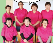
わたしたちが 作っています!