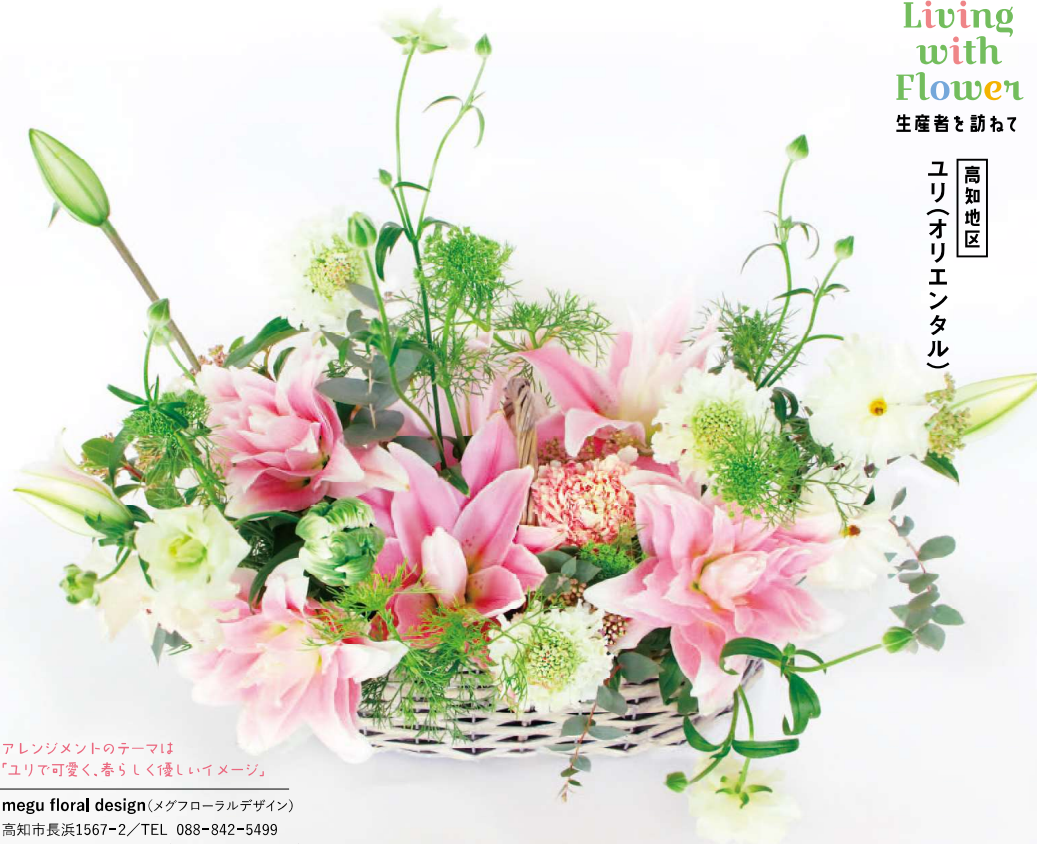
アレンジメントのテーマは「ユリマ可憐く、春らしく優しいイメージ」

megu floral design(メグフローラルデザイン) 高知市長浜1567-2/TEL 088-842-5499 営業時間 10:00～18:00(土曜日は17:00まで) 定休日 木・日(予約あれば対応可)