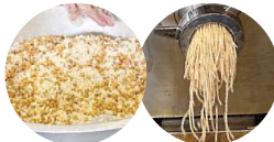
蒸した大豆と米こうじをミンチに