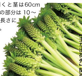
【出荷時期】6月 【主な出荷先】関西

露地で栽培するアフリカ原産のヒヤシンス科で、花姿から「パイナップルリリー」とも呼ばれています。花色はホワイトやラベンダー、ピンクなどがあり、芸西村ではホワイトが栽培されています。開花時の6月頃には、太い茎が真っすぐに伸び、下から順に多数の花が咲き始めます。全てが花開くと茎は60cmほど、花の部分は10〜20cmの長さになります。