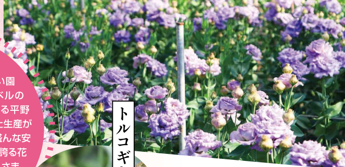
【出荷時期】4〜5月 【主な出荷先】関東

管内で11戸が生産しています。ホワイト、ライトピンク、ラベンダーなど花色も豊か。バラ咲きやフリンジ咲きなど多品種での栽培が盛んで、県内生産量の約半数を担います。しっかりとした茎やボリューム感は華やかさを際立たせ、花束にも多く使われます。