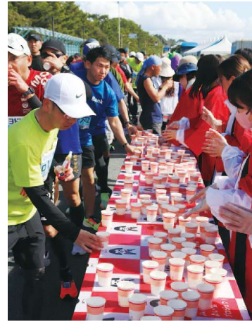
「すっきりしておいしい」と好評だったユズジュース 春野キュウリ部会はキュウリの甘酢漬けを提供