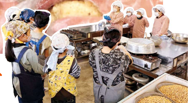
女性部員が先生になり、みそ作りを教えます