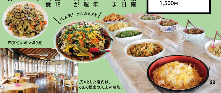
広々とした店内は、 60人程度の入店が可能。

「土長地区」 「農家レストラン まほろば畑」 季節の食材を使った バイキング 1,500円