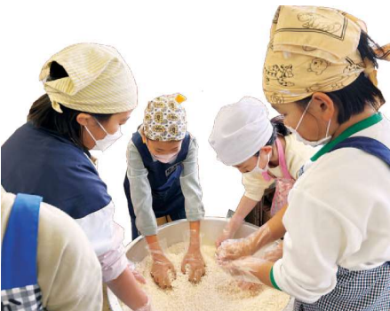
米こうじもみんなで作ったよ