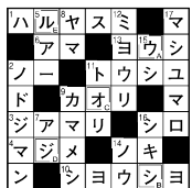
3月号の答え[ウソジレ]

※読者の皆様からいただいたお便りの個人情報、当選者へのプレゼント発送に利用させていただきます。 また、お便りの内容を誌面に紹介する際に、名前(姓のみ)またはイニシャルを掲載させていただく場合があります。