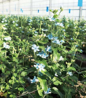
ハサミで1本1本を丁寧に収穫。約50cmほどの長さに5輪付いていることが基準規格で、暑い時期には花の数が減りやすいが、冬季は比較的生育が良いとのこと。

～オキシペタラム～ 南米原産の半つる性の草花で、和名の「瑠璃唐錦(ルリトウワタ)」にもあるように、葉や茎には柔らかな毛が生えていて、綿のように優しい手触り。季節や温度によって花色の濃淡は微細に変化し、咲き終わりには紫色へ変わりながら、花瓶などで冬季は2～3週間と長期間花を楽しむことができます。