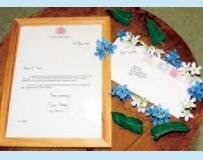
エリザベス女王からの手紙

ドイツで開催された世界最大級の国際見本市「IPMエッセン」で、平成23年に切り花部門の最優秀賞を受賞。平成24年の国際園芸博覧会「フロリアード」ではフロリアード優秀賞を受賞しました。