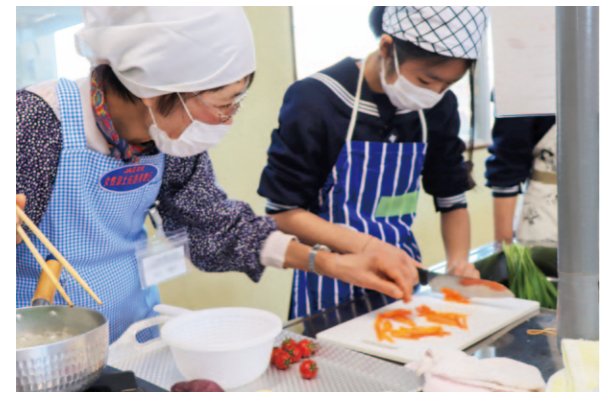
生徒に調理の仕方を丁寧に教える女性部の様子。

女性部土佐香美地区は、毎年香美市・香南市の全中学校で「料理教室」の出前授業を行っています。1月16日・17日、女性部香我美支部は、香南市立香我美中学校の1年生を対象に、地元食材を使ったお弁当作りを行いました。生徒たちは部員のアドバイスをしっかりと聞き、班で力を合わせ「これぐらいやったら、家でも作れそう」「これぐらいの大きさでいい？」「いい匂いしてきた〜お腹がすいてきた〜」と、楽しく調理しました。