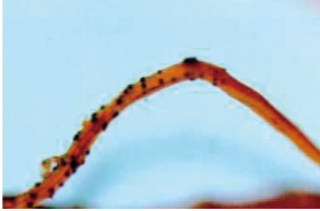
発病株の病徴状況(写真上) 下葉から黄化し、枯死がおこる。 発病株の根元病徴状況(写真中) 主根が銜色になり、細根が脱落する。 発病株の枯死根元に現れた 小黒点(子嚢殻)状況(写真下) 診断の決め手となる。