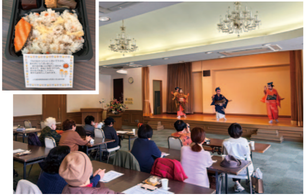
お陽様クラブの舞台を楽しむ参加者の様子。

女性部土佐山田支部は、2月2日、土佐山田支所 3階で『なの花のつどい』を開催し50人の参加がありました。これは地域の方とJA女性部員とのふれあいの場作りを目的とし、今年で3回目を迎えました。最初に昼食として、部員の手作り弁当をみんなで味わいました。その後、地域の民謡クラブ「お陽様クラブ」が6舞台披露。華麗な踊りに参加者は見入りました。その後、南国署の方から交通安全や災害対策の講演を聞き、自分で気をつけること、出来ることを確認しました。続いて高知県警察音楽隊による迫力ある演奏に聞き入り、楽しいひとときを過ごしました。