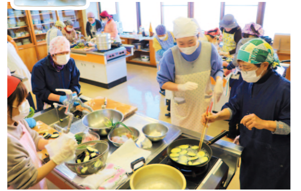
ナス料理のコツを教える部員と参加者

J A高知県安芸地区女性部安芸支部は1月24日、安芸市の女性の家でナスの料理教室を開き、ナス生産者が商工会議所女性会の消費者9人にユニークなナス料理を披露しました。 メニューは「なすのたたき」「ピーマンとゆで卵の豚肉巻き」「ミョウガとささみの天ぷら」の3種類。ナスの生産者である女性部の部員が講師となり、調理方法やアレンジのコツを教えながら調理しました。試食した参加者からは「ナス料理がこんなにレパートリーがあるとは思わなかった」と話していました。