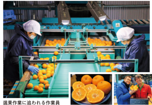
選果作業に追われる作業員

高知県東部で栽培されている「土佐よさこいポンカン」の出荷が最盛期を迎えています。 今年は裏年にあたり、出荷量は例年より約2割減の見込みで150トンを予定しています。 果実はやや大玉で、糖度は例年並みからやや高く、甘くて濃厚な仕上がりになっています。 県内では、サニーマートにて糖度12度以上の特選ポンカンの黒箱入りと袋入りを2月下旬頃まで販売する予定です。 その他、J A高知県ネットショップ「とさごころ」などでも販売中です。