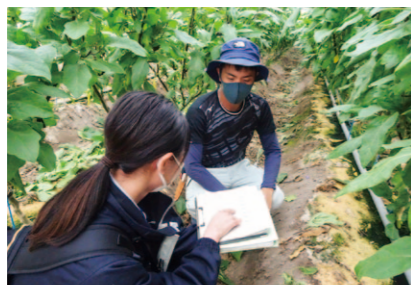
定期的にフィードバック

フィードバックを繰り返していくうちに生産者の「データを見る力」が養われ、環境制御機器の設定を改善する必要性が理解されました。普及指導員と生産者が相談しながら設定を変更し、ハウス内環境を改善しました。例えばハウス内温度が加温機