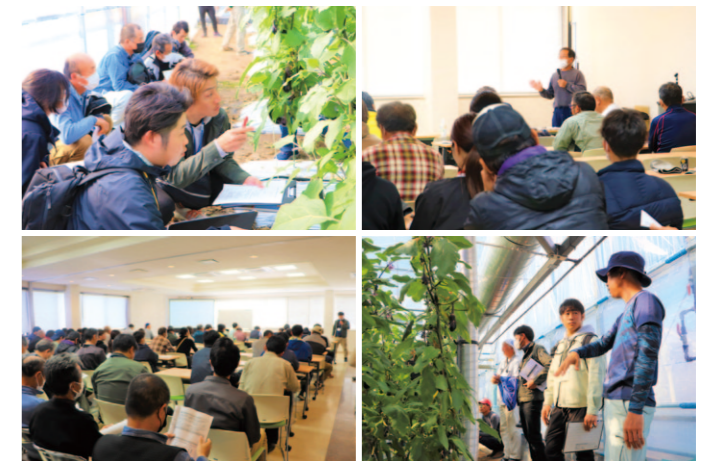
ほ場視察や勉強会を行う参加者ら