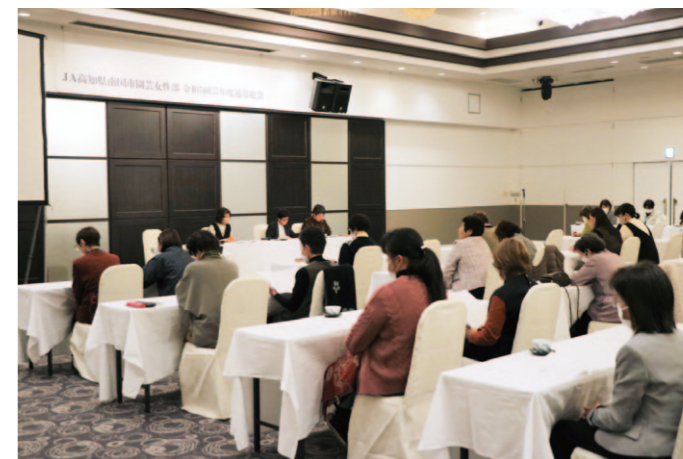
部員ら関係者49人が参加した通常総会