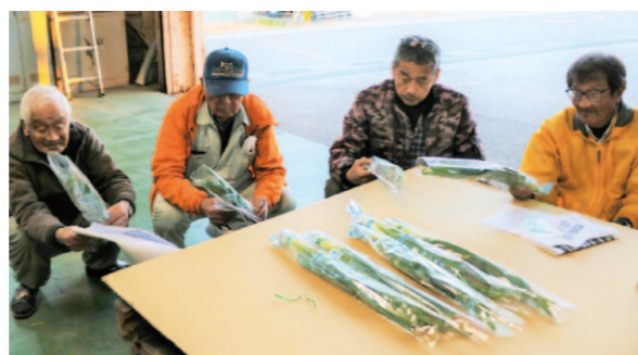
品質を確認する生産者

J A高知県の南国営農経済センターは12月7日、南国南部集出荷場で葉ニンニク目慣らし会を開きました。生産者やJ A職員、市場担当者ら11人が参加し、出荷規格や品質を確認しました。 目慣らし会では生育状況のほか、今年から導入を始める出荷資材の規格説明や、市場2社を対象に行った出荷テストの結果などを報告。資材が変わることで品質や鮮度の向上が見込めることを全体で共有しました。 同J Aの南国市園芸部葉ニンニク部は27戸が約2ヘクタールで葉ニンニクを栽培。収穫は3月いっぱいまで行われ、県内を中心に関西などに出荷されます。