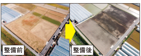
※県営農地耕作条件改善事業（安芸市）整備例

さらに、令和3年度には、「担い手の誘致に必要な施設園芸用農地の整備推進」に向け、地権者の負担を伴わない施設園芸用農地の整備を迅速に実施するため、県が主体となる「県営農地耕作条件改善事業」を新たな整備手法として創設しました。具体的には、施設園芸用ハウスを建設する農地（担い手が確定）、もしくは将来施設園芸用ハウスを建設するために、中間管理機構が中間保有する農地（担い手が未確定）を対象地区として、「1ha以上で担い手への集積率100%」受益地内に施設園芸用ハ