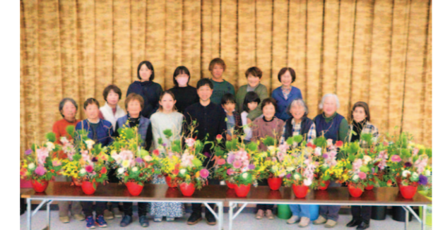
完成した豪華な作品に喜ぶ部員ら

J A高知県安芸地区花卉部は12月28日、あき支所でお正月飾りのフラワーアレンジメント講習会を開きました。部員や家族ら18人が参加しました。花卉生産者が自ら花卉に親しもうと企画し、今回で11回目となります。 参加者は、松や竹、梅、千両、シンビジウムなどを使いアレンジし、最後に各自が栽培したユリやトルコギキョウ、デルフィニウムなどを挿して、お正月にぴったりの豪華な作品を完成させました。 参加者は「お正月に女関に飾って楽しみたい」と笑顔で話しました。