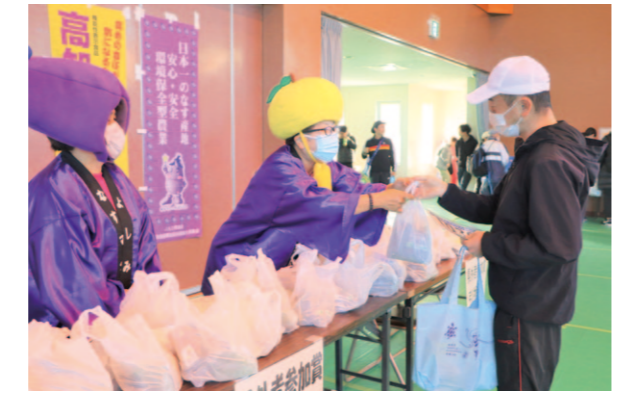
県外ランナーにエールを送りながら野菜を渡すメンバー

安芸市施設園芸品消費拡大委員会は12月10日、「第46回安芸タートルマラソン全国大会」でランナーに同市産の農作物を贈りました。コロナ禍で大会を延期してきたが、4年ぶりの開催となりました。 同委員会メンバーは、県外から参加したランナーに、ナス、ミョウガ、ピーマンにレシビを添えて「安芸市の野菜です。頑張ってください」と一人ひとりに手渡しエールを送りました。参加者は思わぬお土産に喜んでいました。