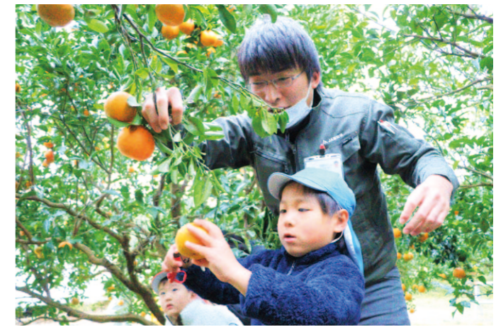
ポンカンの収穫を楽しむ園児ら

J A高知県安芸地区花卉部は12月28日、あき支所でお正月飾りのフラワーアレンジメント講習会を開きました。部員や家族ら18人が参加しました。花卉生産者が自ら花卉に親しもうと企画し、今回で11回目となります。 参加者は、松や竹、梅、千両、シンビジウムなどを使いアレンジし、最後に各自が栽培したユリやトルコギキョウ、デルフィニウムなどを挿して、お正月にぴったりの豪華な作品を完成させました。 参加者は「お正月に女関に飾って楽しみたい」と笑顔で話しました。