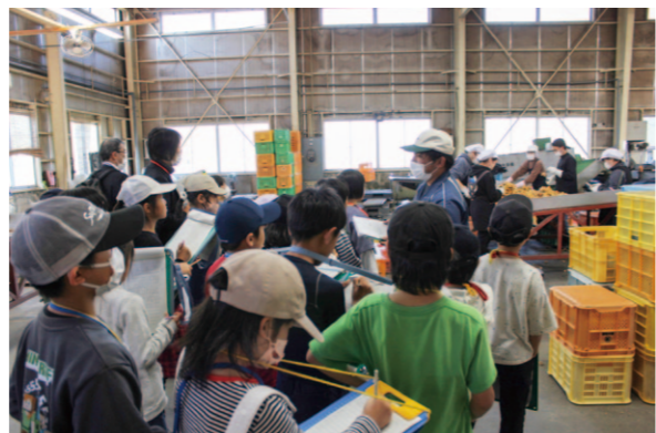
小学生が出荷作業を見学しています。

窪川地区の小学校4校の3年生20人が11月21日、「町たんけん」という授業の一環でカントリーエレベーターと野菜集出荷場に社会科見学に訪れました。小学生たちはカントリーエレベーターの仕組み、野菜の出荷作業を見学。いくつかの質問を行いながら一生懸命メモを取っていました。見学を終えた小学生からは「毎日食べているお米の働き方を知れてとても勉強になった」との声が聞かれ、JAの施設について知ってもらえる良い機会となりました。