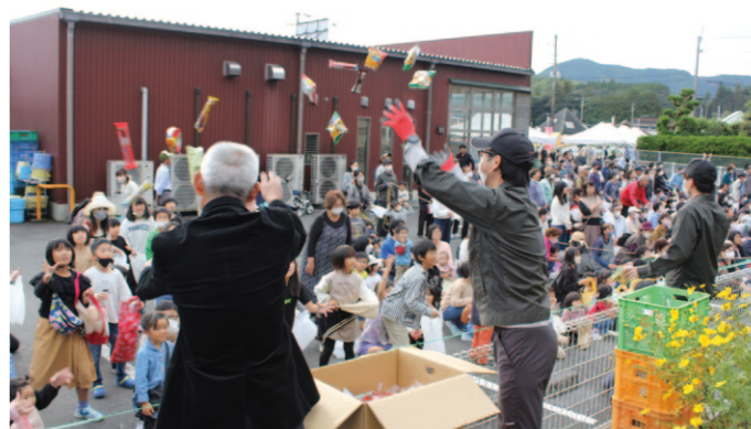
恒例のおもち投げが行われました！