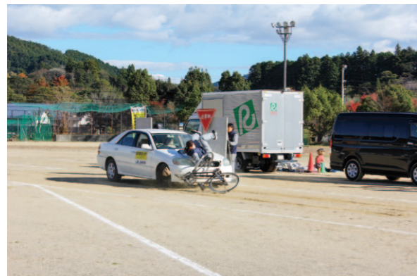
スタントマンによる事故の再現

高西地区信用共済部は11月13日、事故のない安全で快適な学生生活を送っていただくために、窪川中学校で自転車交通安全教室を行いました。高知県警本部、JA共済連協力のもとと全校生徒、教員約270人が参加。自転車の傘さし運転や並列走行などによる交通事故や、トラックの内輪差による巻き込み事故など危険なシーンをスタントマンが再現したほか、被害者遺族の手記などが紹介されました。また、県警からは自転車走行中のヘルメット着用を呼びかけるなど、生徒は事故の危険性について真剣に聞き入っていました。