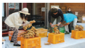
シヨウガ積み競争

農産物の受賞がありました。午後には出品物の販売会が行われ、会場農産物を地元消費者などに広く知っていただく良い機会となりました。他にも会場では、小学生たちが育てたコンテナ生姜の表彰式や恒例のシヨウガ積み競争やニラ飛ばし競争、おもち投げも行われ、笑顔と歓声が溢れていました。