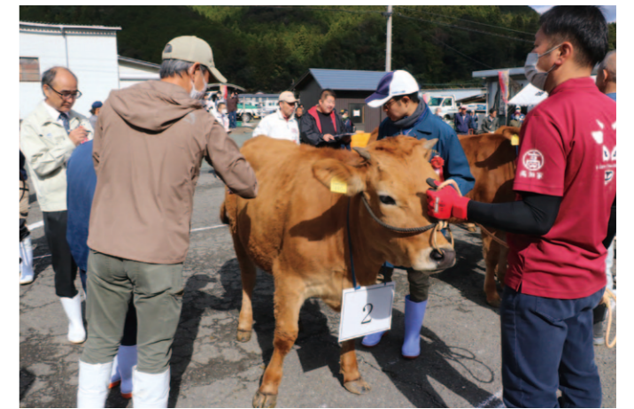
4年ぶりに開かれた嶺北畜産能力共進会