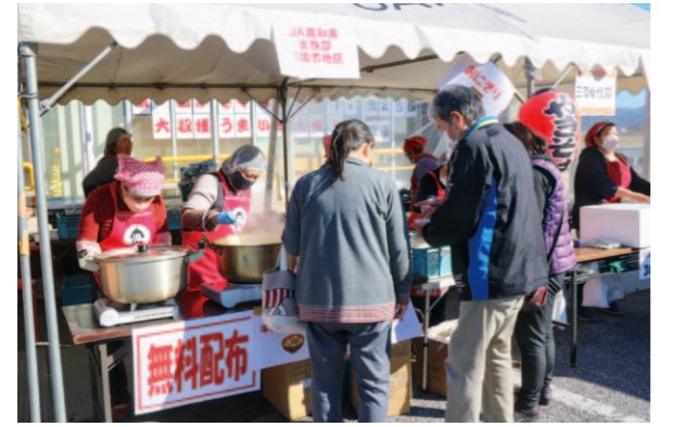
多くの来場客でにぎわったイベント

JA高知県の直販所かざぐるま市で11月25日、『大収穫 うまいもん祭り』が開催されました。利用客に日頃の感謝を伝えようと初めて企画したもので、当日はかざぐるま市運営協議会のメンバーが調理した四方竹の天ぷらや田舎寿司などを販売しました。イベントでは、南国市地区女性部がおにぎりや豚汁の振舞いのほか、支部の女性部による出店も行われました。店舗の外では、各組織による焼きそばやたこ焼き、卵焼き、ミニドーナツ、牛串、四方竹の肉巻きフライなどの実演販売が行われ、買い物に来た多くの来場客でにぎわいました。