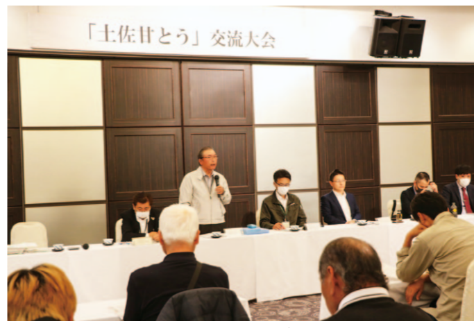
販売対策などについて意見を交わした交流会

JA高知県の直販所かざぐるま市で11月25日、『大収穫 うまいもん祭り』が開催されました。利用客に日頃の感謝を伝えようと初めて企画したもので、当日はかざぐるま市運営協議会のメンバーが調理した四方竹の天ぷらや田舎寿司などを販売しました。イベントでは、南国市地区女性部がおにぎりや豚汁の振舞いのほか、支部の女性部による出店も行われました。店舗の外では、各組織による焼きそばやたこ焼き、卵焼き、ミニドーナツ、牛串、四方竹の肉巻きフライなどの実演販売が行われ、買い物に来た多くの来場客でにぎわいました。