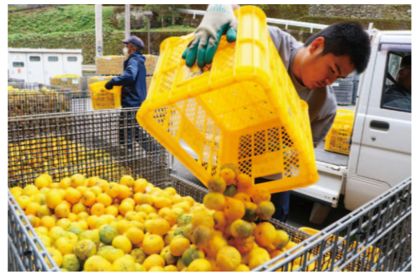
受け込み作業を行う従業員

大豊町にあるJA高知県れいほく柚子加工場で10月17日から搾汁用ユズの受け込みが始まりました。表年にあたる今年は豊作で、日量約30ト、多い日で50トのユズが生産者から持ち込まれ、場内は爽やかな香りに包まれていました。持ち込まれたユズは、従業員が目視で腐敗の有無を確認。規格外を選別した後、搾汁機で果汁や果皮に分別します。果汁と果皮の原料販売のほか、ジュースやポン酢に加工し全国で販売。現場担当者は「高知が誇るユズの魅力を国内外に発信し、嶺北産のユズ果汁を多くの方に味わってほしい」と話しました。