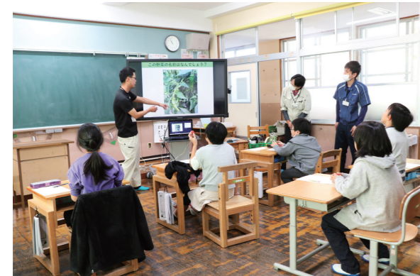
クイズを交えながら楽しく学んだ出前授業

地域が誇る「れいほく八菜」を地元小学生に知ってもらおうとJ Aや県の職員が学校に出向き出前授業を行っています。10月13日には、本山町立吉野小学校の3、4年生を対象に授業を開催。嶺北普及所の職員が講師となり、人と環境に優しい農法で栽培されているれいほく八菜の特徴や魅力を伝えました。 児童からは、米ナスと普通ナスの育て方の違いや本山町で最も多く栽培されている野菜等についての質問があり、担当者が丁寧に回答。児童らは、栽培圃場の見学や管内の野菜を使った調理実習などを通して、学びを深めました。