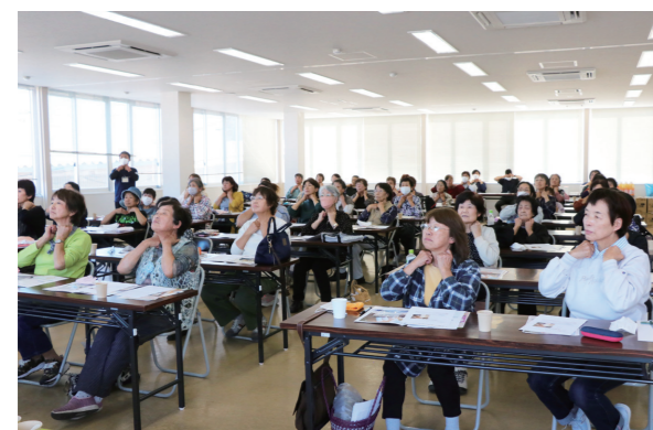
スキンケア商品を体験する参加者

J A高知県女性部南国市地区は10月17日、「エコープ商品講習会」を開きました。女性部員52人が参加し、商品説明や体験を通して楽しみながら理解を深めました。 講習会では、エコープ商品を取り扱う築野食品工業（株）を講師に招き、担当者が「こめ油」と「米ぬかスキンケア in ano」の特徴や使い方を説明。こめ油を使ったレシピを紹介しながら、商品の魅力を伝えました。 体験会では実際にスキンケア商品を試供しました。効果を実感した参加者は、「しっとりしていていい」「試しに使ってみたい」と関心を高めていました。