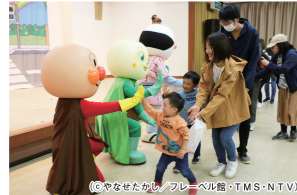
アンパンマンたちと触れ合う参加者

J A高知県土長地区は10月29日、次世代を担う子どもたちに交通ルールを楽しく学んでもらおうと「J A共済アンパンマン交通安全キャラバン」を開きました。地域貢献活動の一環として開かれたイベントには、管内の親子連れ88組308人が来場。「それいけ！アンパンマン」の仲間たちと一緒に身体を動かしながら交通ルールを学びました。 参加者は、ストーリーや音楽に合わせて信号機の意味や横断歩道を渡る時の約束事などを確認しました。イベントの最後には握手会も行われ、参加者はアンパンマンたちと笑顔で触れ合いました。