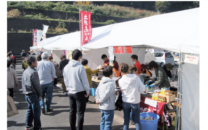
多くの来場客で賑わったイベント