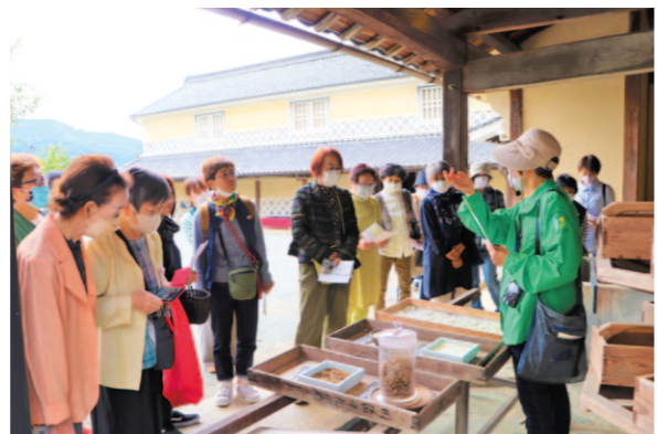
重要文化財を見学する部員ら

JA高知県の女性部安芸地区は10月14日、愛媛県で「女性大学ときめき学園」を開きました。部員や地域住民22人が参加し、愛媛県内の観光を満喫し魅力に触れました。 内子町の町並み散策や、JA直販所「さいさいきてや」での買い物で、旬の地元農産物を生かした郷土料理を堪能した後、タオル美術館を訪れました。参加者は「コロナ禍で旅行に行けなかつたので、久しぶりに部員同士が顔を見て話すことが出来て、いい息抜きになった」とほほ笑んでいました。