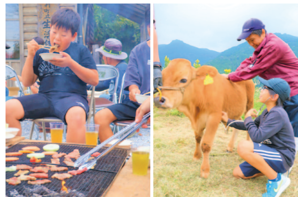
土佐あかうしを堪能した後、触れ合い体験で牛の鼓動を聞く児童

高知県畜産会が主催、JA高知県安芸地区の肉用牛部会が協賛で、10月20日、奈半利町で「土佐あかうし」の触れ合い体験学習を開きました。 同学習は、畜産への理解と地元農産物の消費拡大を図ることが目的で、毎年行っていて、今年で14年目になります。 同町立奈半利小学校の5年生18人と保護者らが参加し、バーベキューで土佐あかうしを堪能した後、牛との触れ合いを通じて食と命の大切さを学びました。