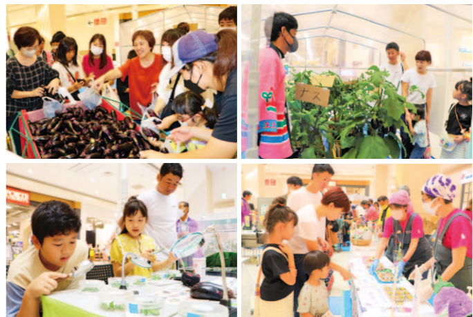
フェアで様々な企画を体験する来場者ら