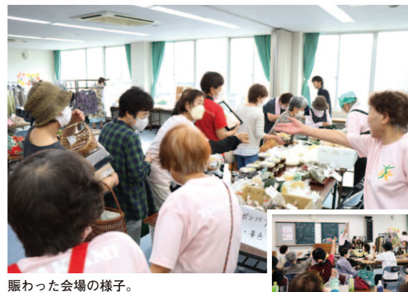
賑わった会場の様子。

女性部香北支所は8月24日、香北支所2階で、JA女性部ミニマルシェを開催しました。この活動は部員相互の親睦を図るとともに、SDGsを意識した終活資源活用を行うことを目的に開催。 また会場では女性部手作りの炊き込みごはん・五目寿司・みそなども販売しました。部員だけでなく地域の方々も多く足を運んでくれ、じゃんけん大会などの催しで大いに盛り上がるなど、交流を深める有意義な一日となりました。