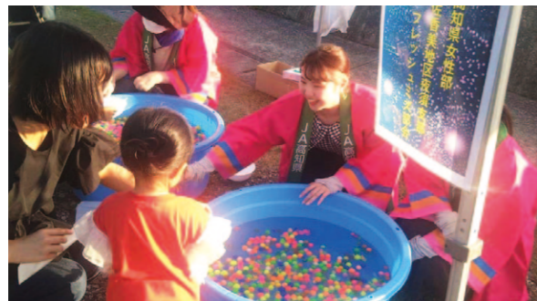
スーパーボールすくいを親子で楽しむ様子。

女性部夜須支部フレッシュミズ部会は、9月3日夜須町手結山で行われた「なつまつり」にスーパーボールすくいを出店しました。 この祭りは、地域の子どもたちのために開催。当日はユニフォームや、お宝さがしゲームを行ったり、フランクフルト・アイスクリン・めだかすくい・スーパーボールすくいが会場せましと並び、全て無料とあり子どもたちは大喜びで夢中になって「なつまつり」を楽しみました。