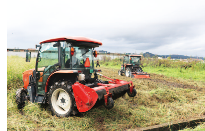
トラクターの作業機を使って除草する青壮年部員