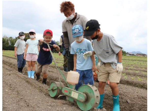
昨年の種まきの様子 播種機(上)、手植え(下)