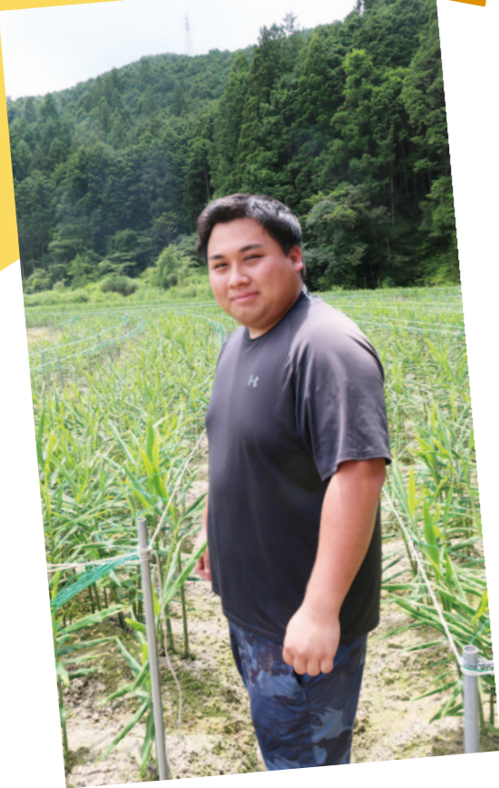
佐川支所管内より