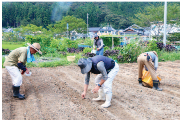
猛暑の中大豆の種まきをする部員ら

助けあい組織「赤い禪隊」は7月27日、佐川町でみそ用大豆の種まきを行い、新隊員を含めた8人が参加しました。用意した大豆の種約1.5kgを3aの畑へまき、鳥よけのため防鳥ネットを張りました。参加した隊員は「何事も無く、大きくなってほしい」と話しました。一昨年前に野生動物の被害を受けたため、現在の畑で2年目の栽培となります。大豆は12月に収穫を行い、来年2月にはみそを仕込む予定です。