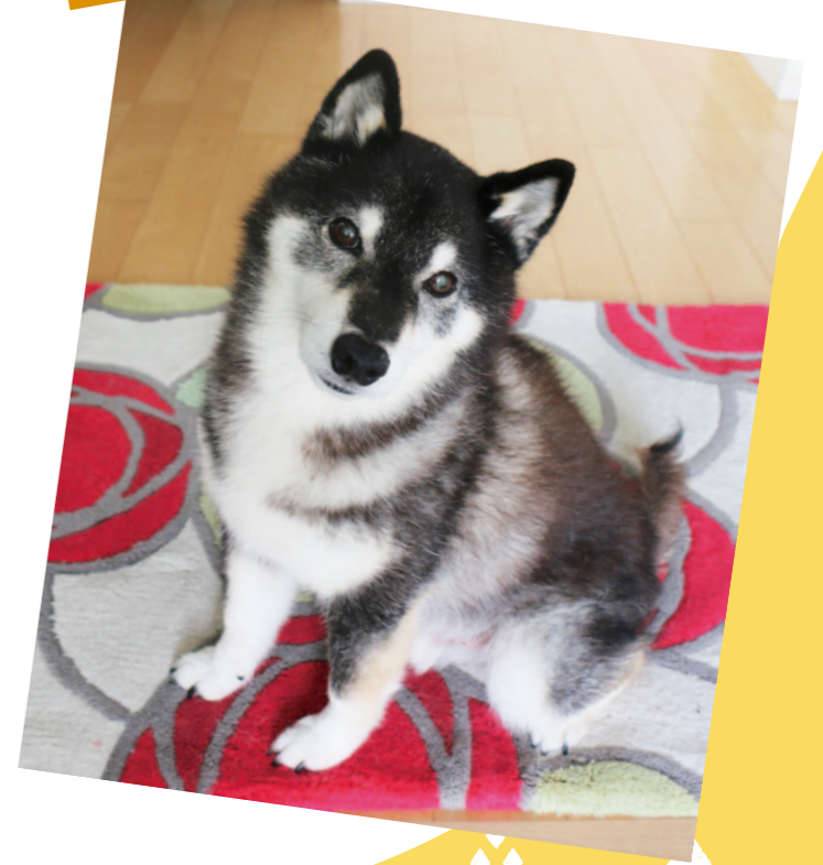
斗賀野支所管内より