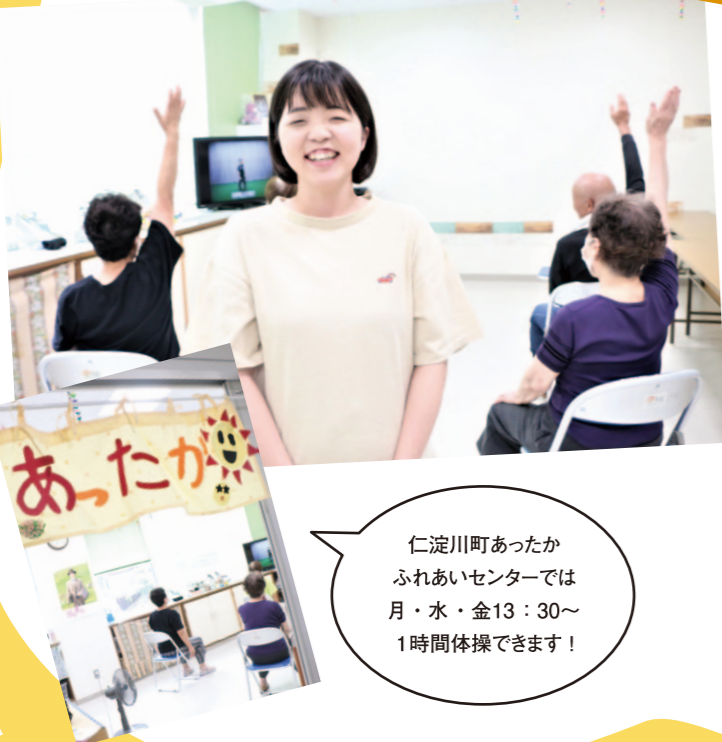
吾川支所管内仁淀より