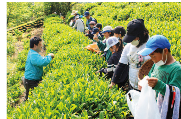
教わりながら茶摘みを行っています。

4月末から5月上旬、四万十生萎栽培研究会と高西営農経済センター営農指導課が毎年行っている農業用コンテナを使った「コンテナ生姜作り」の授業を、8つの小学校で96人の児童が行いました。5月10日、四万十町立窪川小学校の3年生36人がコンテナ生姜の種の植え付け作業に取り組みました。 授業ではJA職員説明のもと、児童たちはコンテナに土やケイントップ、堆肥、肥料を混ぜ、土作りを行い、種シヨウガを植え付ける作業を行いました。初めての体験に子供たちからは「土を運ぶのは重く、シヨウガの種の植え付けの大変さが分かった。収穫まで水をたくさんあげ大きな生姜を作りたい」との声が聞かれました。 今後同研究会とJA営農指導員が収穫に向けて引き続きアドバイスなどを行い、次回は7月に、芽が出て大きくなったシヨウガに誘引、敷きわら作業を行う予定です。