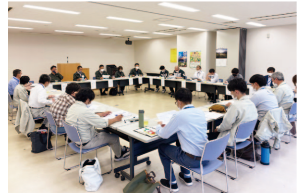
今後の施策について協議されました。

5月15日、令和5年度津野山地域営農連絡協議会全体会が開催されました。本会は栲原町・津野町・須崎農業振興センター・西部家畜保健衛生所・JA・両町の地域支援員（オプザーバー）の関係機関25人で構成されています。 会では、本年度に係る営農体制の設置と各品目の具体的な目標に向けての取り組み計画や課題等が協議され、津野山地域PT（プロジェクト）行動計画が策定されました。