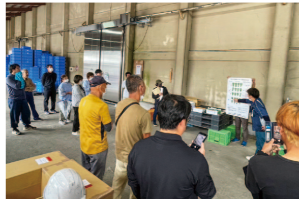
出荷規格について説明を行っています。

5月30日、四万十夏秋ピーマン生産部会は窪川集出荷場で目慣らし会を開催しました。生産者19人とJA職員、普及所が参加し、等級ごとの出荷物や出荷規格の確認を行いました。 同部会では45人の生産者がハウス栽培・露地栽培を合わせて約370アールで夏秋ピーマンを栽培しています。令和4年度は約253t以上の出荷量があり、令和4年度より露地栽培で問題となっている「斑点細菌病」対策として、「簡易雨よけ栽培」にも取り組み始めました。品質を維持して出荷できるように定期的に目慣らし会を行います。