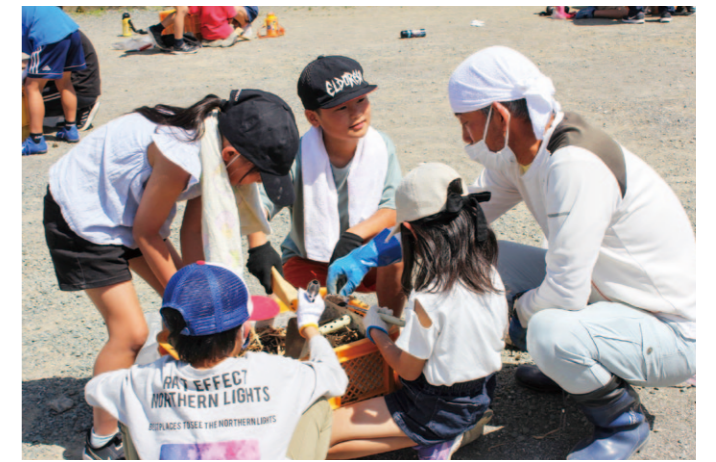
みんなで協力し合って土作りを行っています。