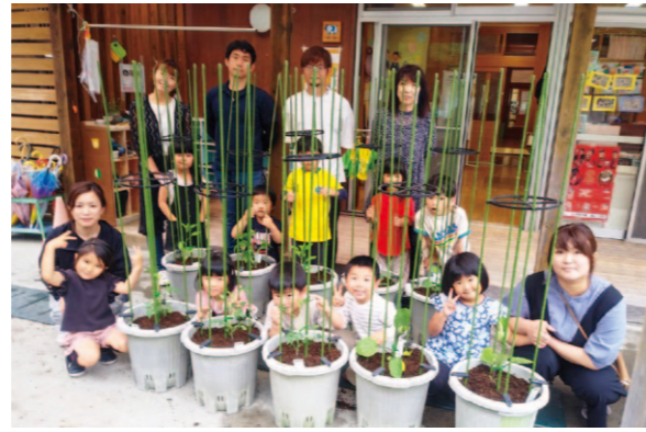
当日は参観日で保護者も一緒に植え付けました。

5月31日、津野町立さくらんぼ園で野菜の植え付けが行われました。園児たち自ら野菜の植え付けやお世話をすることで、野菜に興味をもってもらい、好き嫌いをなく食べてもらうために毎年行われています。高西営農経済センター・津野山経済課からは職員が講師として参加し、植え方のコツや育て方を伝えました。園児たちも土にふれプランターにキュウリやピーマン、ミニトマト等を植え付けていき、成長を楽しみにしていました。夏にはそれぞれの美味しい野菜の収穫です。一生懸命お世話をしたたくさん収穫してください！