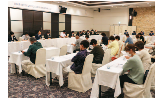
販売強化に向けて開かれた市場消費地情勢報告会議

南国市園芸部大葉部会は5月23日、コロナ禍で開催が見送られていた「市場消費地情勢報告会議」を開きました。5年ぶりに再開した会議には、関西や中四国13社の市場取引担当者や生産者、JA役員44人が参加し、生産資材の高騰が続く中で、限られた出荷数量でいかに収入増へつなげていくかなどについて議論。出荷方法や有利販売に向けた契約出荷の在り方などについて意見を交わしました。 同部では今年度部会全体で90t、販売金額2億7千万円を目標に、市場と産地が一体となり安定的な供給と販売の実現を目指します。