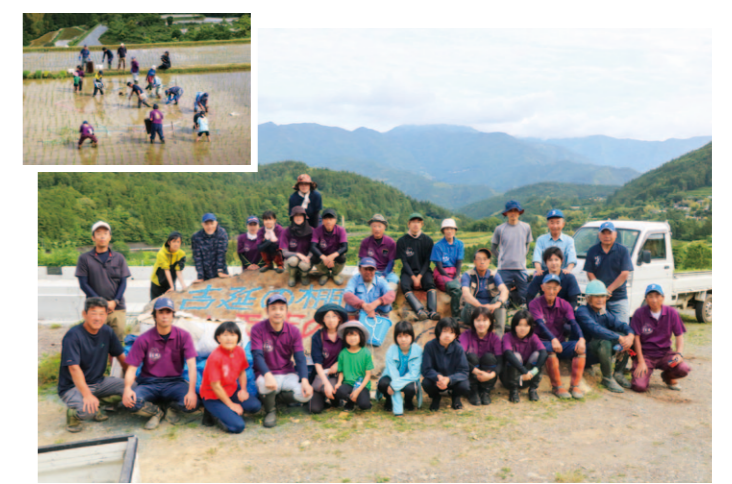
田んぼアートの田植えに集まった組合員ら