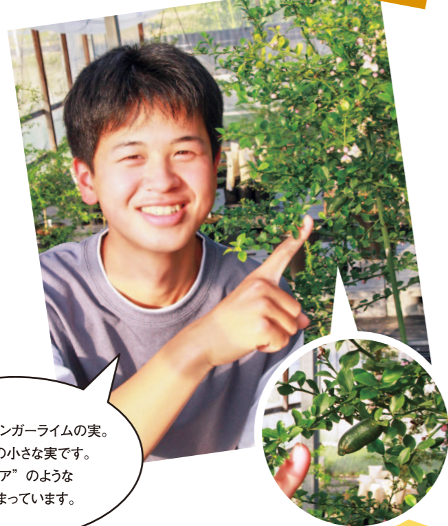
完熟前のフィンガーライムの実。指先ほどの小さな実です。「キャビア」のような実が詰まっています。