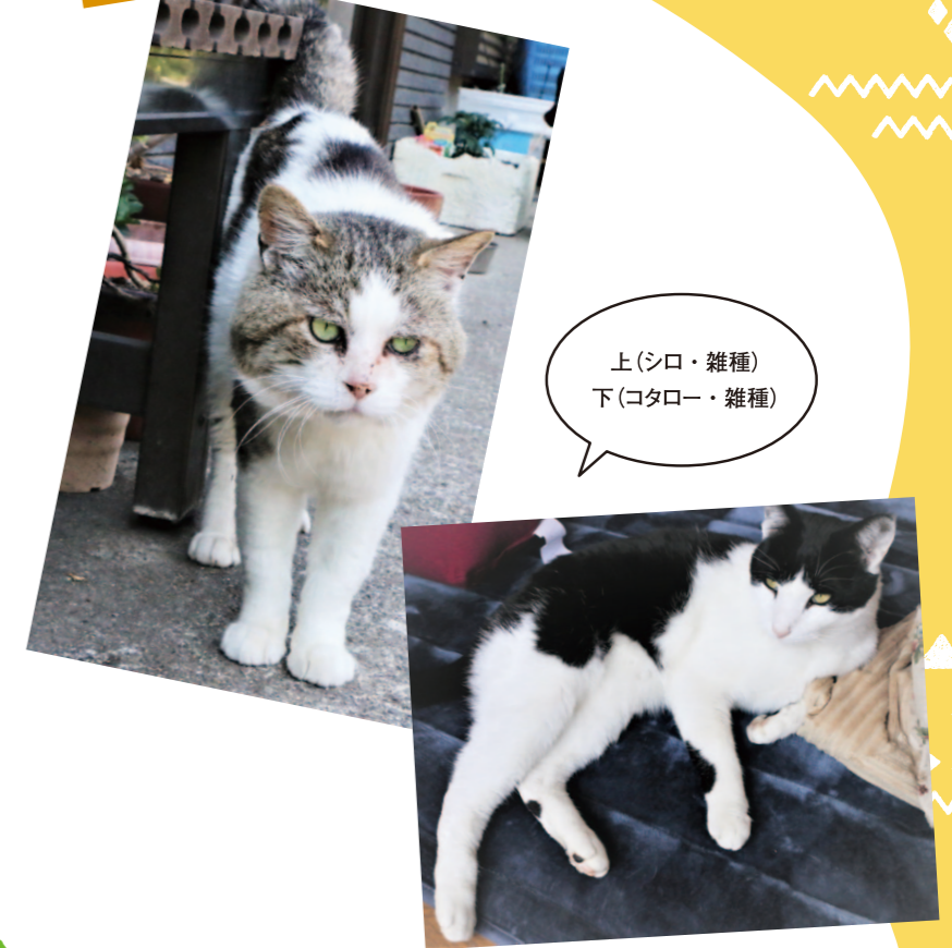
上(シロ・雑種) 下(コタロー・雑種)