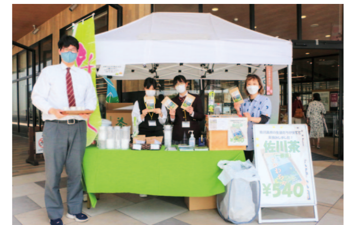
佐川茶の販売をする佐川高校生ら