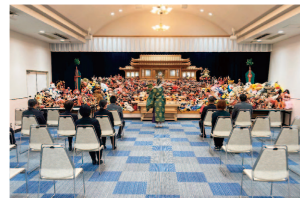
人形供養祭の様子

コスモス営農経済センター購買課は5月24日、JA葬祭会館「ルミエールコスモス」で人形供養祭を開催しました。 ひな人形、フランス人形、ぬいぐるみ等、思い出の詰まった様々な人形を、たくさんの方の組合員・地域住民の皆様からお預かりし、丁寧に供養しました。 地区内のルミエール及び各支所購買では、盆の灯笼・提灯等の商品を取り扱っています。ご購入の際にはお気軽にお問合せください。