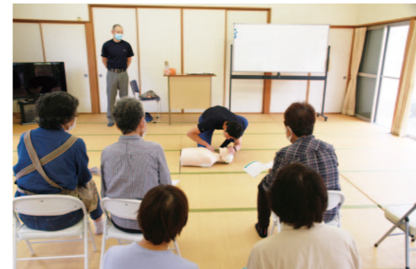
救命救急を学ぶ部員ら

土佐市女性部北原地区の谷地地域の女性部員は5月23日、谷地公民館でAEDや止血、熱中症対応などを学びました。地域住民も含めて16人が参加しました。 講師の土佐市消防隊員からは、AEDの使い方や注意点を伝える「救急車が来るまでに救命手当をすることが大切」と話しました。 毒蛇や毒虫、熱中症の対応についても説明しました。「救急車が病院に行くか、迷ったときは#7119にかけて相談してほしい」と声掛けもしました。