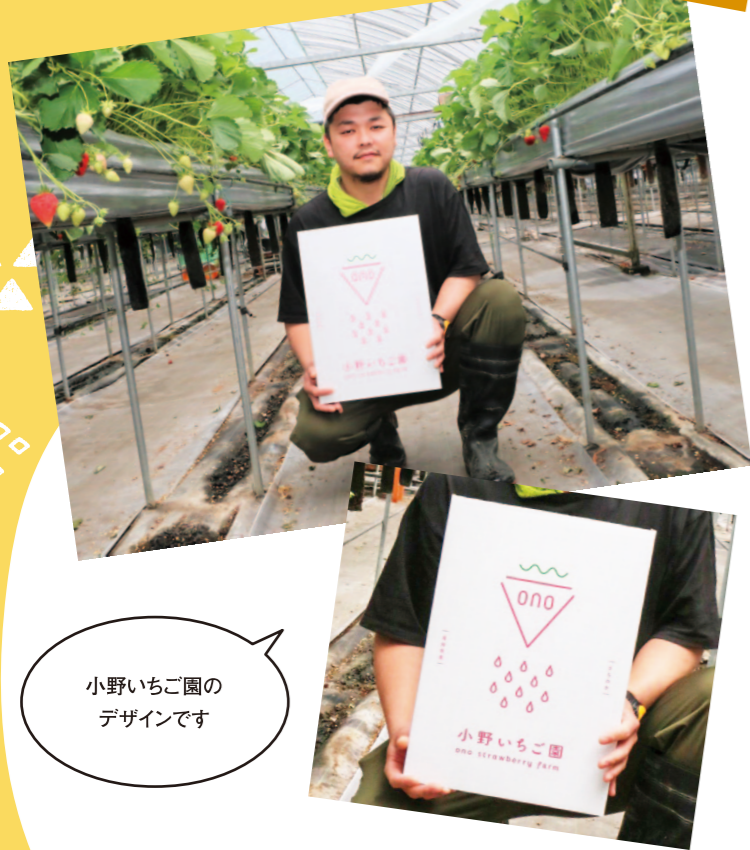
小野いちご園のデザインです