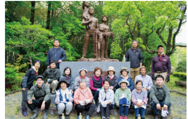
清掃を終えてきれいになった庭で撮影しました。

高知市春野町にあるJAの研修センター敷地内に「農業青年婦人希望の像」がある庭「農協の森」があります。毎月、県内の青壮年部と女性部が持ち回りで清掃しており、幡多地区は毎年4月に青壮年部幡多本部と女性部幡多地区が協力して清掃作業を行っています。4月24日は、新採用職員や人事異動で営農指導員になった職員らが青壮年部員と作業し、女性部員も7人が参加。落ち葉を集め、草引きをして終了後、すっきり気持ちの良い場所になりました。