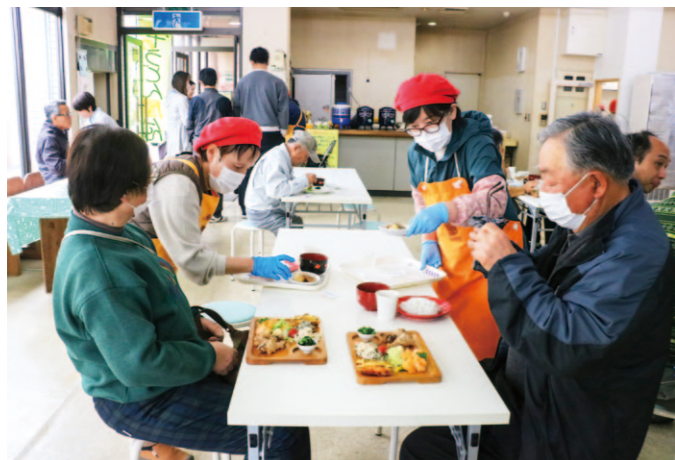
多くの来店客に賑わった牛のうどん屋さんカフェ