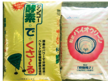
表：残渣腐熟促進資材

④施設内では温度が70℃以上になり、深さ10cmで50℃、20cmで40℃に達します。この状態で20〜30日放置すると土壌病原菌やセンチュウ類が死滅します。