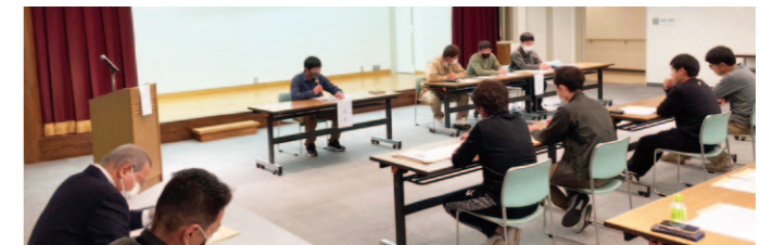
各地区で開催された青壮年部の通常総会