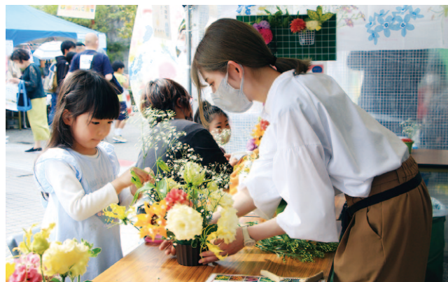
楽しそうに花を生ける子ども

家族とブースを訪れた6歳の女の子は、トルコギキョウやダリアを中心に生けて「好きな花をたくさん入れた。母の日のプレゼントにしたい」と話していました。