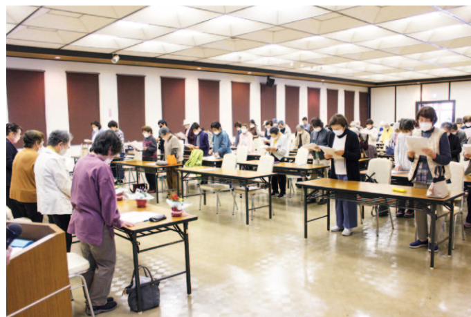
JA女性組織綱領の唱和をしています。