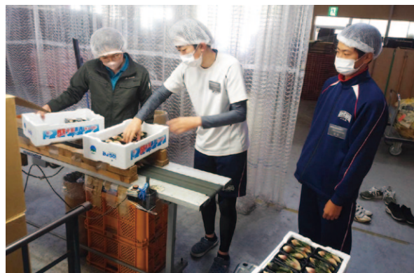
ミョウガの出荷作業を行っています。

4月26～28日までの3日間、津野町立東津野中学校3年生2人が高西営農経済センター津野山経済課に職業への理解を深めるための機会として職場体験に訪れました。 職員に教わりながら、1日目はミョウガをレールに並べ、包装を行う出荷作業や肥料出し、新茶販売に向けての準備などを行いました。2日目は米苗の配達、3日目は茶工場での作業を体験しました。中学生は質問をするなど職員の話しに熱心に耳を傾けながら、職場体験に取り組みしていました。