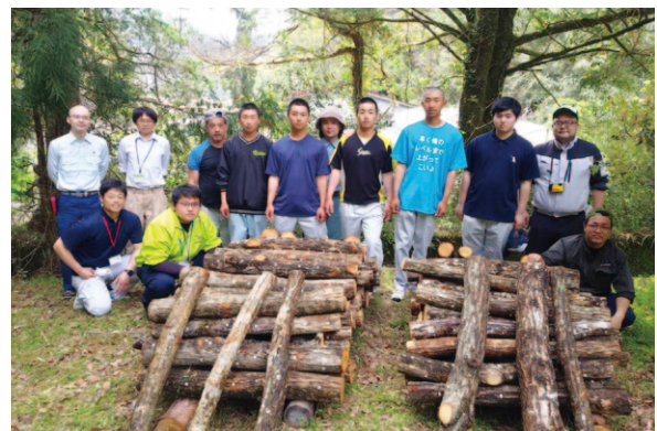
梶原高校のみなさんお疲れ様でした。

高西営農経済センター津野山経済課は4月中旬、高知県立梶原高等学校2、3年生を対象に、原木椎茸の種駒打ち体験の出前授業を行いました。 授業では生徒たちが原木にドリルを使って穴を空け、その穴に種駒を打ち作業を行いました。その後、植菌した菌糸の活着を図るため仮伏せの体験を行い、合計約100本の原木に植菌。生徒たちからは「初めて原木にドリルで穴を空け、難しかったがとても良い経験ができました」との声が聞かれました。今後も津野山地域の産産業を知ってもらえるようこの活動を続けていく予定です。