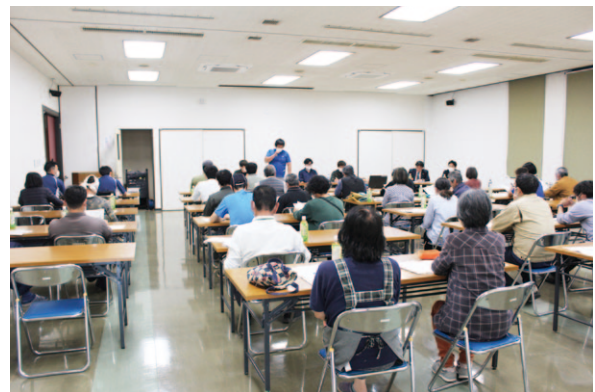
夏秋ピーマン部会ではR5年度から新たに6名の生産者が増えました。

夏秋ピーマン部会は4月20日、令和5年度栽培講習会と出荷検討会を開催。大果大阪青果株式会社を招き、生産者30人が参加しました。 講習会では、営農販売事業本部が県内の促成ピーマンの現状、大果大阪青果株式会社が県外情勢や今年の見通しについて報告があり、普及所からは、栽培管理について説明。出荷検討会では、販売課より令和5年度の出荷規格や出荷方法の説明がありました。 夏秋ピーマンの露地栽培は10月末頃まで、雨よけ栽培は11月末頃まで収穫が続く予定です。