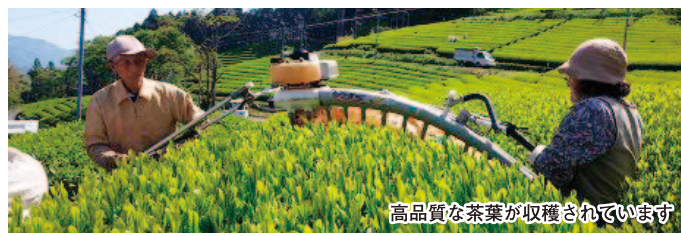
高品質な茶葉が収穫されています