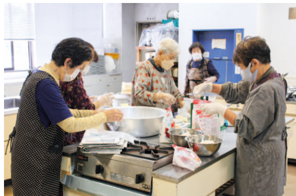
部員の方々が材料を混ぜ合わせています。

JA高知県女性部四万十地区松葉川支部は4月7日、毎年恒例のホウ酸団子を作りました。ホウ酸団子はゴキブリ駆除に使用される毒エサで、タマネギと牛乳をミキサーにかけホウ酸、小麦粉、砂糖を加えて耳たぶほどの硬さにしていきます。今回は約160個のホウ酸団子を作りました。 部員からは「タマネギが目に見える」など和気あいあいと作業に取り組みました。ホウ酸団子は「ごきぶり団子」ともいって、各家庭の台所の隅などに置き、安価で出上がり、効果があると評判です。