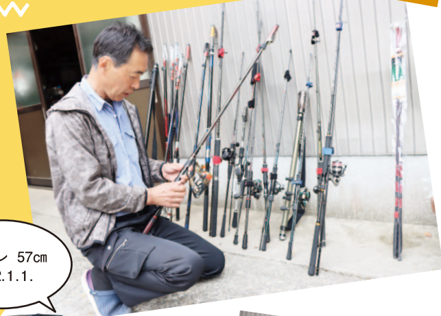
尾長グレ 57cm 2022.1.1.

釣り仲間には色々な年代の人がいて、先輩後輩もなくみんな仲良く和気あいあい。仲間内で開いた釣り大会では、10歳の子が優勝したそう。ここには載せきれないほど釣り話をたくさんしてくださり盛り上がりました♪