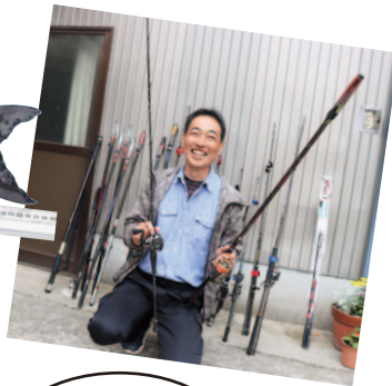
アオリイカ 2kg超え 2022.3.31