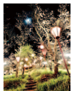
香南市野市町にて▶