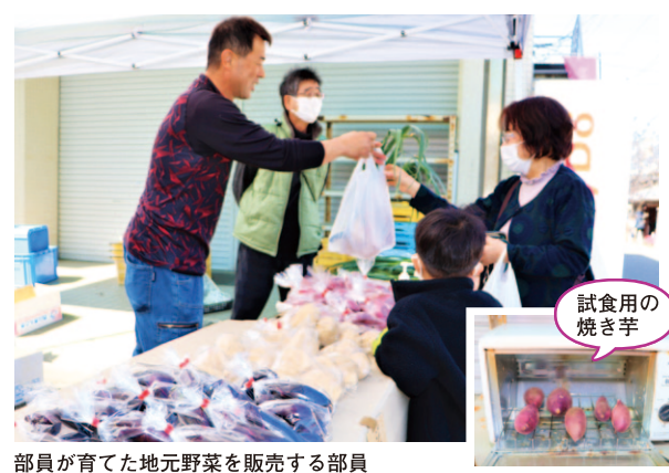
部員が育てた地元野菜を販売する部員

青壮年部吉良川支部は3月5日、室戸市吉良川町で開かれた「吉良川の町家ひなまつり」に出店し、地元産物をPRしました。ひなまつりは、平成10年から毎年開催されており同イベントに、毎年出店しています。 部員が栽培したサツマイモやジャガイモやポンカンなどの野菜や果物が販売され、試食用にイモの甘さが引き立つ焼き芋を来場客に振舞いました。 来場者は「西山金時はイモがすくく甘い」と笑顔で出来たての焼き芋を頬張っていました。