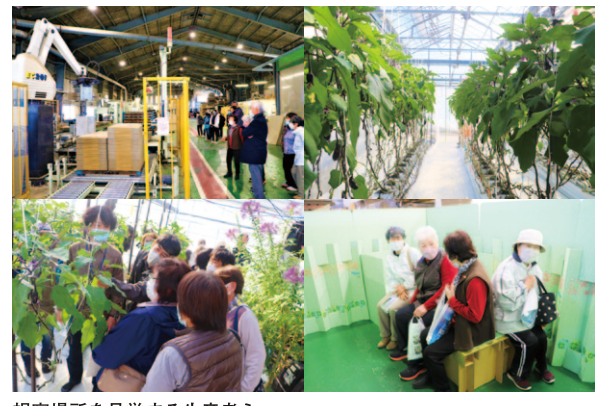
視察場所を見学する生産者ら

安芸支部園芸女性部は2月28日、高知市で視察研修を開きました。安芸地区管内の女性生産者ら32人が参加しました。 (株)タケナカダンボールの製造工場では、ナスの出荷時に使うダンボールの生産現場見学や、災害時用の段ボールベルトや間仕切りなどを体験し最新の技術等を学びました。 技術センターでは、ナス、ピーマン、シントウの試験栽培の圃場を視察。 参加した生産者は、「今後の農業にも取り入れていきたい」と話しました。