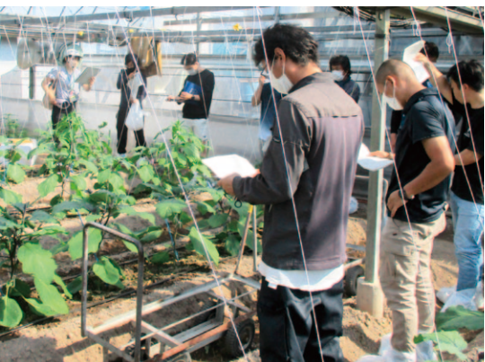
受講と現地研修の様子