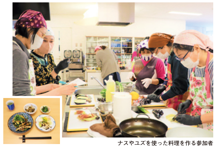
ナスやユズを使った料理を作る参加者

安芸市施設園芸品消費拡大委員会は3月7日、「なすの酢味噌和え」と「なすと豚肉のすき焼き風井」のレシピ動画2本を公開しました。動画投稿サイト「ユーチューブ」やJA高知県のホームページで発信し、ナスの魅力を紹介しています。 「なすの酢味噌和え」は、簡単に作れるので作り置きのおかずにお勧めです。冷蔵庫で冷やすとさっぱりといただけます。 「なすと豚肉のすき焼き風井」は、フライパン1つで短時間で栄養がとれるレシピです。 一週間レシピを紹介する次の金曜日メニューは、「なすとエリンギのグラタン」を公開する予定です。 動画を見てご家庭でもなす料理を作ってみてください。 現在、「なすマダム」の「ユーチューブ」動画は計14本公開中です。 同委員会は、今後もナス料理の動画を制作します。レシピ動画は右のQRコードからご覧いただけます。