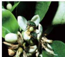
コアオハナムグリ

灰色かび病は、花弁落下期に雨の多い年や多湿圃場で発生が多いので、花弁落下期に1回目の防除を行います。降雨が多い場合は、1回目の薬剤防除から7〜10日後に2回目の散布を行います。