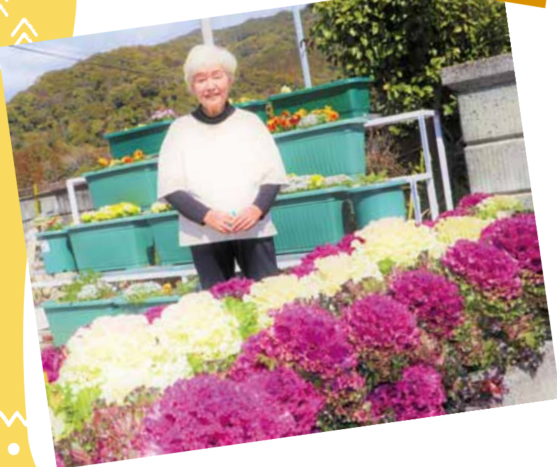
室戸支所管内より