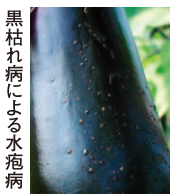
黒枯れ病による水疱病