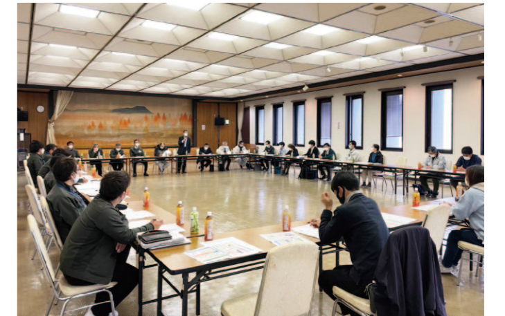
各関係機関と生産振興について意見が交わされました。

津野山力石茶工場では、令和4年度津野町土佐茶生産強化事業により「CDカメラ方式茶用色彩選別機」を導入しました。色彩選別機導入により、お茶の価格低下を招く茎や古葉を除去することができ、荒茶価格の向上が期待されます。また、異物混入防止にも繋がります。安心して安全な荒茶出荷が行えます。 4月6日にはメーカー立会のもと、茶工場作業に携わる生産農家の方々と稼働テストを行いました。実際に選別機を通すと茎の除去に大きな力を発揮することが確認でき、間もなく始まる新茶の摘採にむけ期待が高まりました。