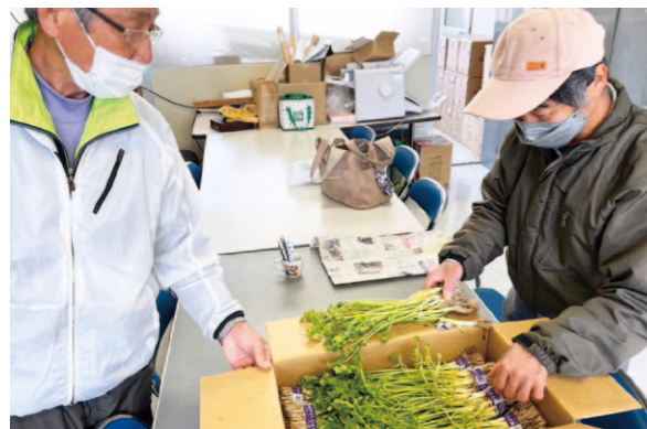
水耕セリはサラダだけでなくジュースにしてもおいしいです。

四万十水耕セリ部会は3月7日、窪川野菜集出荷場で目慣らし会を行いました。生産者、JA職員が参加し、他県産セリの見比べや水耕セリの調理を行いました。セリは、一般的には水田での栽培が主流です。管内では水耕で栽培しているため「水耕セリ」と呼ばれており、独特のえぐみが少なくシャキシャキとした食感が特徴。四万十水耕セり部会では6名の生産者が92アールのハウスで栽培しており、県内だけでなく全国各地へ出荷しています。