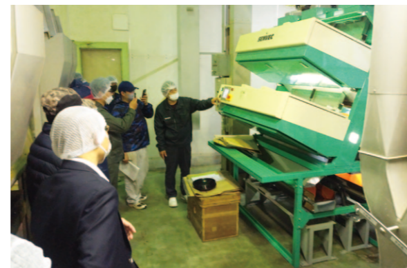
試験運転を慎重に行いながら効果を検証していき、厳格な管理を行ってまいります。

津野山力石茶工場では、令和4年度津野町土佐茶生産強化事業により「CDカメラ方式茶用色彩選別機」を導入しました。色彩選別機導入により、お茶の価格低下を招く茎や古葉を除去することができ、荒茶価格の向上が期待されます。また、異物混入防止にも繋がります。安心して安全な荒茶出荷が行えます。 4月6日にはメーカー立会のもと、茶工場作業に携わる生産農家の方々と稼働テストを行いました。実際に選別機を通すと茎の除去に大きな力を発揮することが確認でき、間もなく始まる新茶の摘採にむけ期待が高まりました。