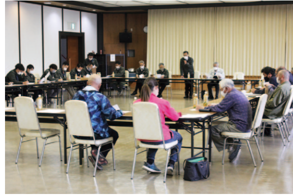
指導体制について話し合いが行われました。

3月30日、令和4年度の営農指導体制検討会を行いました。これは、営農アドバイザー活動を起点とした、営農指導事業の取り組みについて検討する場として毎年開催しているものです。当日は、9品目20人の営農アドバイザーの活動と指導事業の取り組みについて報告がされました。令和4年度はコロナ禍であったことから活動はやや制限されましたが、令和5年度について営農アドバイザーとより連携して生産技術の高位平準化に向けて取り組んでまいります。