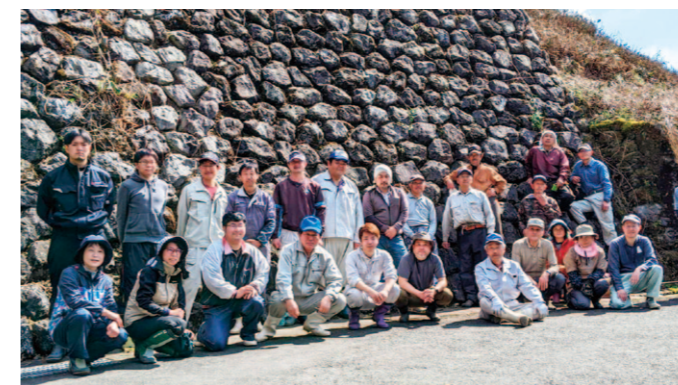
茶園を守る取組を続けていきます。

3月9日、農業振興意見交換会では四万十町、須崎農業振興センターなどの関係機関を招いて農業振興意見交換会を行いました。生産組織からは20組織の部会代表者が参加し、生産振興につながる雇用対策や既存事業の拡充、栽培支援について意見が交わされました。 特に近年は資材などの高騰が著しく、農業経営を圧迫していることから新たな施策の要望が出されました。関係機関からは「高騰に対して生産量を上げてコストを下げる方向への考え方も必要ではあるが、生産者の負担ができるだけ少なくなる対策に取組んでいく」との返答をいただきました。また、雇用対策については部会内の詳細な取組み状況を調べ夏頃に県につないでもらうこととなりました。 今回出された意見・要望の具体的な根拠、経営に与える影響額などを各部会で再度確認し、生産振興につながる施策立案につなげてまいります。