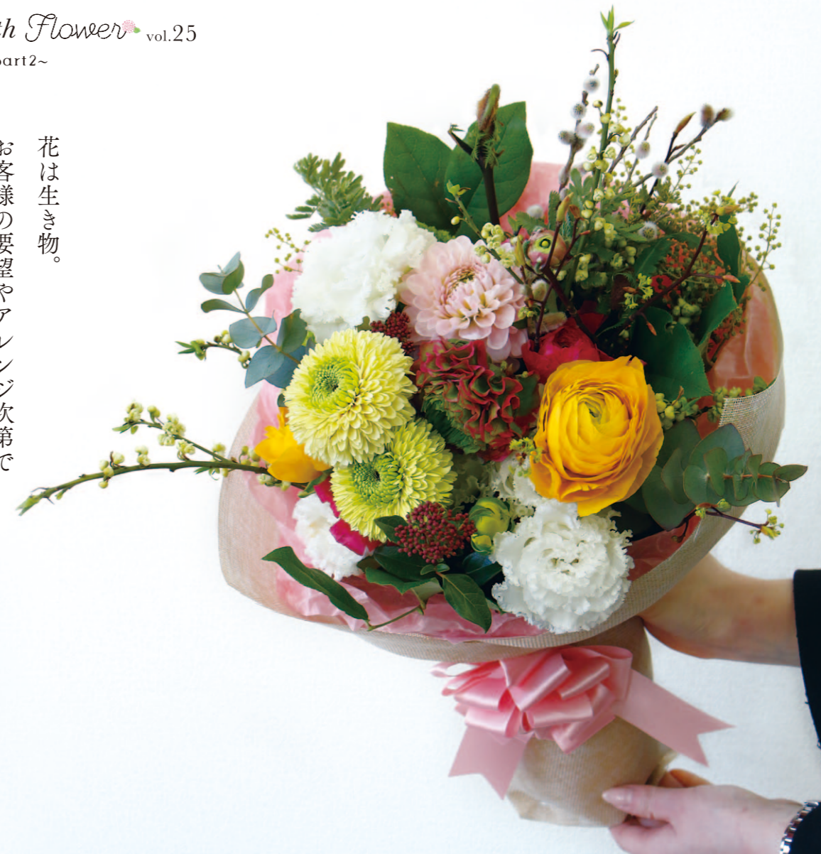
高知県産のガーベラ、トルコギキョウを使いミモザやアオモジなどを織り交ぜた春を感じさせる花束(写真は5,000円)

花は生き物。 お客様の要望やアレンジ次第で 同じ仕上がりにならないのがおもしろいところ。 常に新鮮な気持ちで向き合えます。