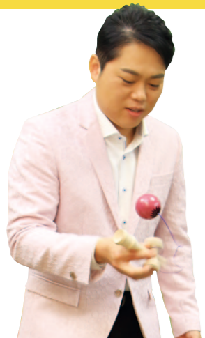
ナス色の「ナスけん」で得意のけん玉を華麗に披露してくれました。