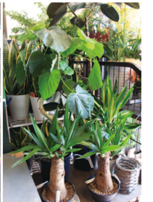
これからの時期、会社などでの贈答用に活躍する鉢植えも豊富。