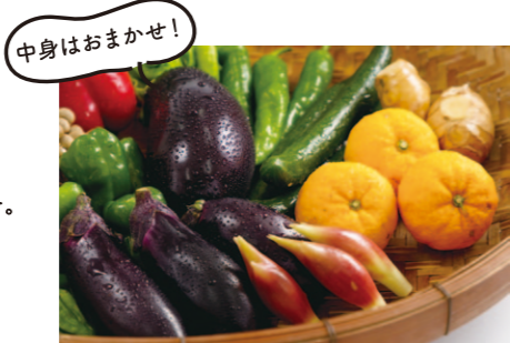
とさごろ 野菜詰め合わせセット

クイズ正解者の中から 抽選で計 20 名様 応募締切は 令和5年 5月5日 (当日消印有効) プレゼントの当選者発表は発送をもってかえさせていただきます。