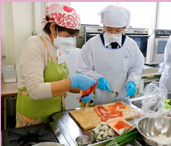
豚肉に明太子をぬり、千切りにしたピーマンを巻いていきます。