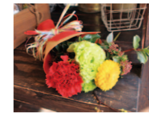
1,000円のミニブーケも ご用意可能。