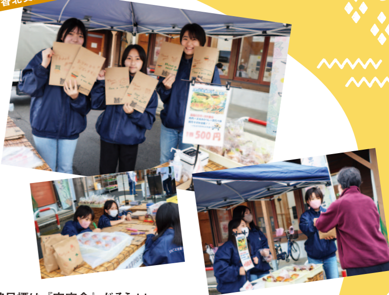
香北支所管内より

当日、直販所に来たお客さんに部員から声をかけ、懸命に商品説明をしながら販売に繋げていました。販売の合間にはバーガーを入れる紙袋に手書きで可愛いイラストを書いたり、自分たちが楽しみながらもしっかり活動をPRしていた姿が、とてもイキイキしていました(*^-^*)