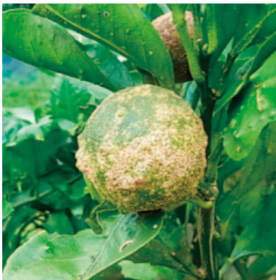
葉・果実上のいぼ状病斑