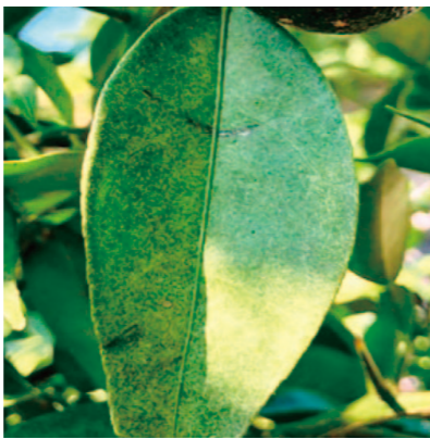
ハダニに吸汁された葉