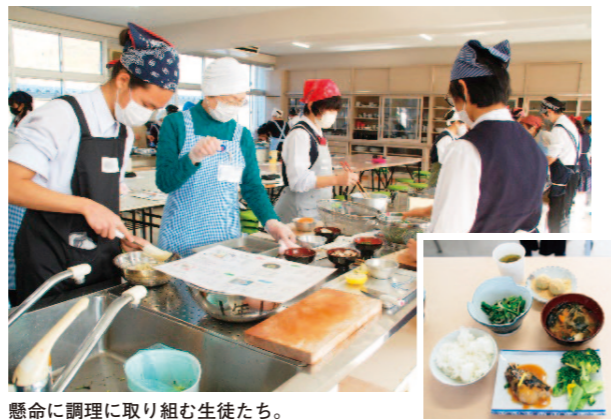
懸命に調理に取り組む生徒たち。

女性部土佐香美地区が平成20年から取り組んでいる「出前授業」。香美市・香南市の全中学校で、1年生・2年生を対象に、「各市の「ねらい」に沿った地場産物を使ったメニューで料理教室を行っています。