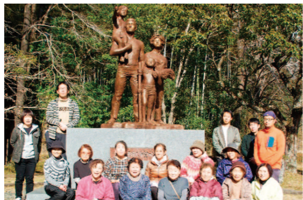
綺麗になった森で記念撮影。

香美地区青壮年部・女性部は、1月20日、部員ら18名で高知市春野町にある「農協の森」の清掃活動を行いました。