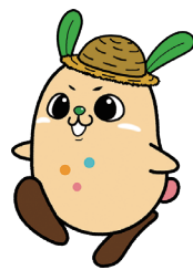
マスコットキャラクター コチット

〒781-8510 高知県高知市五台山5015番地1 TEL 088-821-6091 FAX 088-856-6980 https://ja-kochi.or.jp/