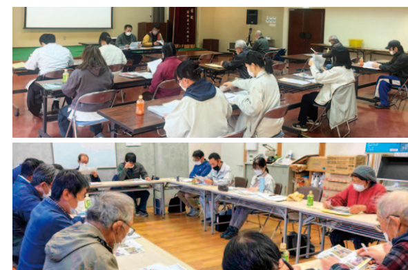
各品目部会反省会の様子