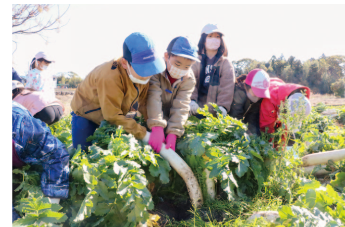
協力してダイコンを収穫する児童