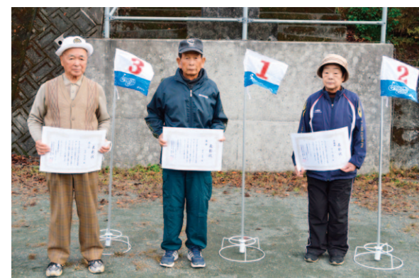
33人が参加したグラウンドゴルフ大会

れいほく地区は11月14日、年金友の会グラウンドゴルフ大会を開きました。コロナ禍の影響により、3年ぶりの開催となった大会には33人が参加し、汗を流しました。