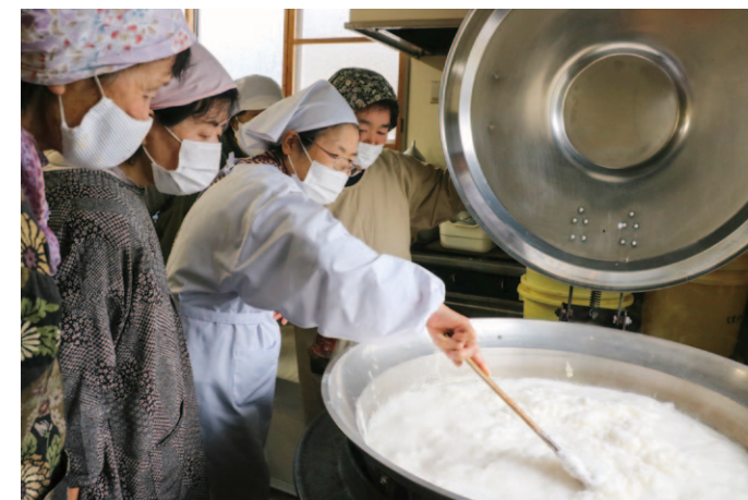
真剣な表情で豆腐づくりをする参加者