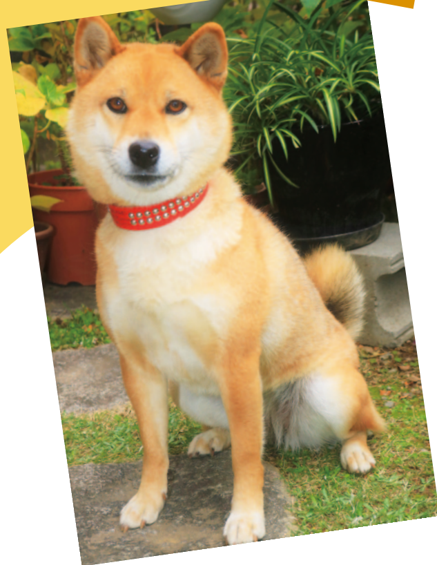
田野支所管内より