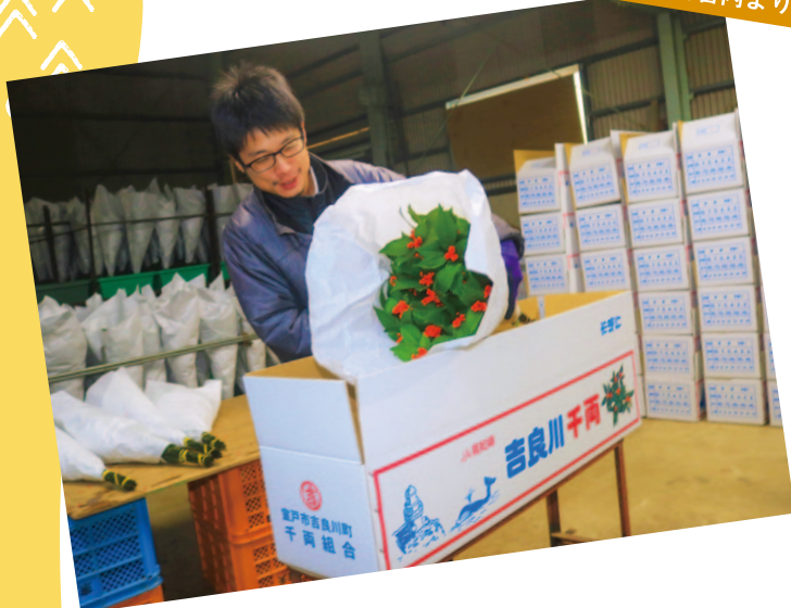
吉良川支所管内より