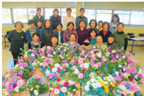
他支部との交流を喜ぶ女性部員ら

女性部安芸地区は、12月18日、安芸郡芸西村で支所めぐりウォーキングと「作り教室」を開きました。地区内の各支部が持ち回りで開き、今回で3巡目となります。支所めぐりには、全8支部から25人が参加しました。参加者は、芸西支部の女性部員からクラフトテープの「作り」を教わり、完成させたかごバックには芸西の花を使ってフラワーアレンジメントを作りました。女性部員は「他支部の人と普段は中々会えないので顔を合わせて話せる時間が嬉しかった」と喜びました。