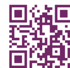
動画はこちらから見てね♪