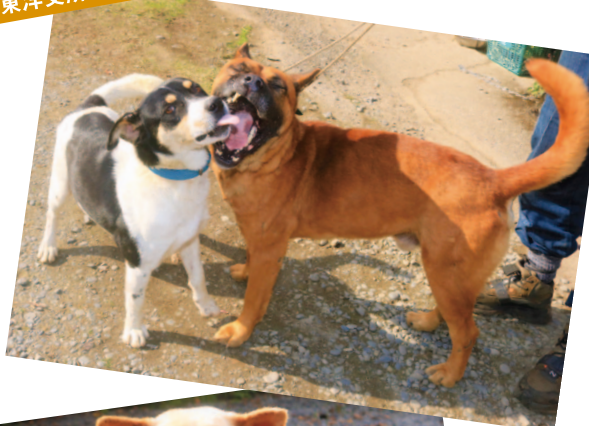
東洋支所管内より

卓也さんは「今年は夏場に雨が降らず心配していたが、立派な千両が育ち嬉しく思う。千両の実は赤色だけでなく黄色や紅など様々な色があるので多くの人に楽しんでほしい」と話してくれました。