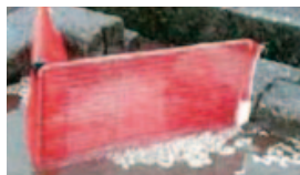
捕集ネットの設置

自作ネットの材料は玉ねぎネットやクリップなど安価なものなどで容易に作ることもできます。また、プラスチック被覆肥料の代替技術として、プラスチックを使用しない緩効性肥料や流し込み液肥の活用などがあります。被覆殻の低減に向けた取り組みへの協力をお願いします。