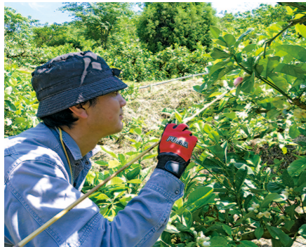
そのままでは受粉しにくいので小夏の花粉を人工交配。役のかかるこの大変な作業のおかげで大きくきれいな果形になります。