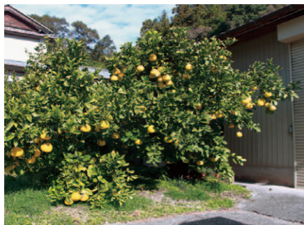
最初の原木から生まれ樹齢80歳の今も現役の土佐文旦の木。味にバラつきがなく「人間と一緒に年がいったら無茶なことはせん」とのこと。