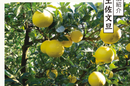
表紙紹介 土佐文旦

高知県を代表する特産果実のひとつで、露地栽培の土佐文旦は主に1〜4月にかけて出荷します。独特の爽やかな芳香とプリっとした食感が特徴で、一粒食べると小さな実がはじけて、果汁がジュワーツと口いっぱいに広がります。土佐文旦は他の果物に比べて皮をむくのが少し大変ですが、包丁を使えば比較的簡単にむくことができます。動画で土佐文旦の基本的なむき方を紹介していますので、ぜひご覧ください。