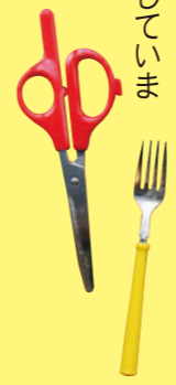
柑橘バサミ、フォーク、シトラスピーラー、ムッキーちゃん。これらを駆使してムキムキします。