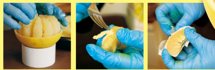
サイズが揃った実を立てて並べていきます。薄皮は、フォークで丁寧に取っていきます。実の端にも注意を払うと、美しい仕上がりに。