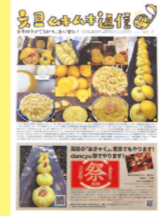
(右)ベストセラーになった「文旦好きがこうじて」 (左)平成31年に創刊した「文旦ムキムキ通信」

そんな中、自分を見つめ直すタイミングで「やりたいことリスト」のトップに思いついたのが「文旦本」の出版でした。