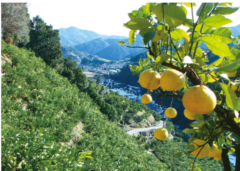
日がまんべんなく当たる文旦山。