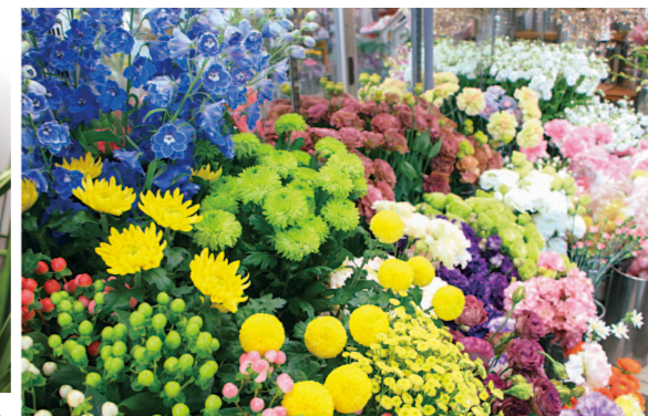
季節の花はスーパーマーケットからの注文も多くなります。