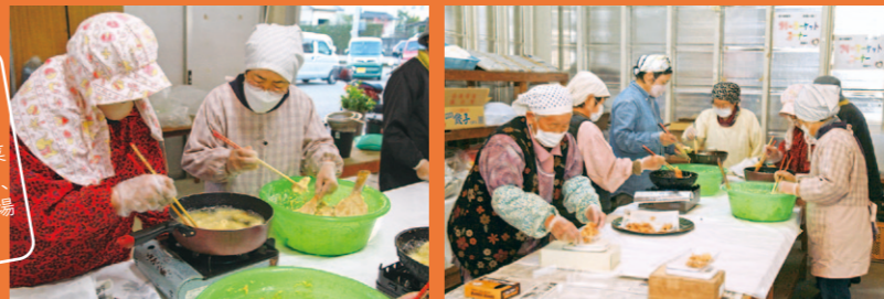
ピーナッツ揚げの作業風景

主に波介地区の生産者33人が出荷していて、「出荷しゆう入たちとおしゃべりするの楽しい」「ヒジ、ヒザが痛いけど、野菜作りが楽しくてようやめん」と、地域のコミュニケーションの場にもなっているんだよ。