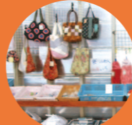
旬のお野菜の他、お総菜、手芸品なども並ぶよ！