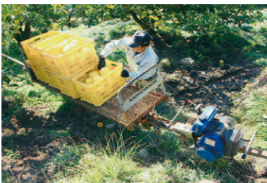
急斜面かつ重労働のためモノレールは欠かせません。