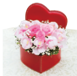
シンビジウム、バラ、カスミソウ、ポリシャスを使ったバレンタイン仕様のアレンジメント(写真は5,000円)