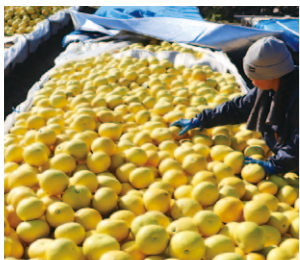
野囲い:このひと手間ですぐ美味しい文旦ができます。

ムロでゆっくり追熟させることで酸が抜け、水分を飛ばして甘味を凝縮させる「野囲い」。板で四角く囲い、地面にわらとむしろを敷いて文旦を入れ、ビニールを被せてわらでふたをします。最近ではわらの代わりにアルミシートを被せることも。より温暖な宿毛市では、木なりで年を越します。