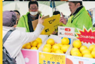
中央公園での土佐・ぶんたん祭の様子。日曜日に近いこともあり県外客にPRするには絶好の場所。