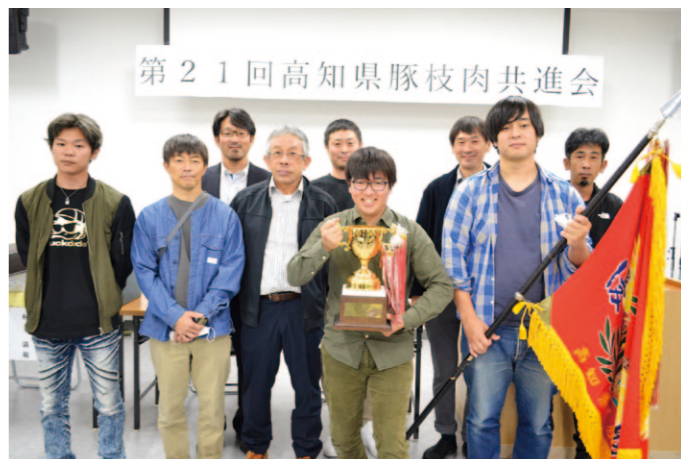
受賞おめでとうございます！