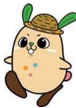
マスコットキャラクター コチット

〒781-9511 高知県高知市北御座2-27 TEL 088-821-6091 FAX 088-856-6980 https://ja-kochi.or.jp/