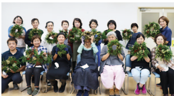
リースの仕上がりに大満足の参加者。

女性部夜須支部は、10月6日、夜須集出荷場2階で「リース作り」を開催。講師3名を迎え、部員12名が参加しました。 まずはリースの土台となる輪を杉で作り、用意してくれた植物や実などを土台に差し込みながら足していきました。 講師の方から「ルールは1つ。差し込んだものが、落ちないこと。これだけです。難しく思わず好きに作って下さい」とアドバイスを受け、みんな思い思いに材料を手にしたリース作りを楽しみました。