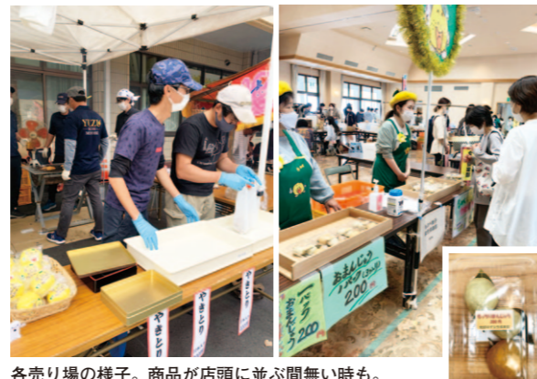
各売り場の様子。商品が店頭と並ぶ間無い時も。

物部ゆず青年部と物部ゆず女性倶楽部は、10月8日、奥物部ふれあいプラザで行われた、第1回奥ものへ青空市に出店しました。 この催しは、物部地域に新たな集いの場づくりを目指し、物部地区集落活動センター準備会が企画し開催。 会場には多くの飲食店や手作り雑貨、リサイクル品などが並び、青年部は焼き鳥600本、女性倶楽部は饅頭160パックを販売。 地域住民との交流を深めるとともに、農業者組織として地域の活性化に協力しました。