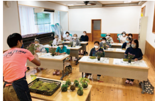
苔玉作りの説明を真剣に聞く部員。

女性部香我美支部は8月3日、土佐町の方へ12名で一日研修旅行に行きました。 行程は、早明浦ダムを散策後、さめうら荘で昼食。楽しみにしていた土佐あかうしを堪能し、みんなにこにこ顔に。そして午後は苔玉づくりに挑戦。講師の方から作り方のポイントや、時間が経っても茶色にならない育て方の説明を受けながら、思い思いの苔玉を作りました。 コロナ禍で十分な活動が出来ず、ようやく実行できた研修旅行。久しぶりに会う部員同士、話に花が咲く有意義な時間となりました。