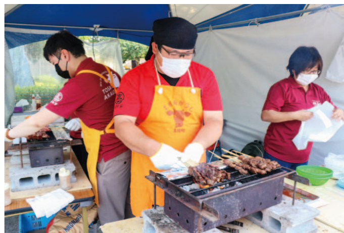
大盛況だった「こうち農畜産フェア」(高知市中央公園で)