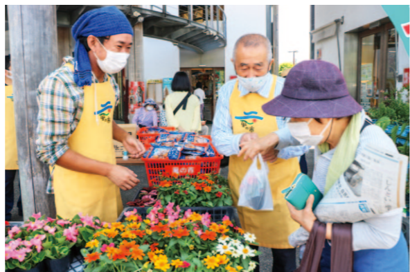
お好みの花を選ぶ来店客(風の市にて)

直販所・かざぐるま市と風の市は5月8日、母の日のイベントを開きました。イベントでは、両直販所で1000円以上お買い上げいただいたお客様を対象にお好きな花鉢等をプレゼントしました。 今年は、マリーゴールドやペコニア、ガザニアなど数種類の花を用意。来店客は色とりどりの花の中からお好みの花を選んでいました。風の市では、花鉢のほかミレービスケット200袋を準備し、県外客に向けてPRも行いました。 店内はお目当ての商品を買い求める来店客で賑わい、大盛況のイベントとなりました。