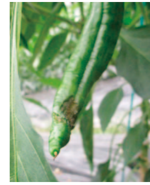
事故の事例：土佐甘とうの尻ぐされ果→

灌水量が不足すると、尻腐れ果が発生しやすくなります。天候や樹勢、着果量を観察し灌水量を調整しましょう。枝が混みあっていると湿度が上がると、病気が発生しやすくなります。通気や採光を確保する意味でも、整枝・摘葉を行い、天窓やサイドの換気を行う事で湿度を下げましょう。整枝や不良果の除去により着果負担を防ぐことで、尻ぐされ果の対策になります。