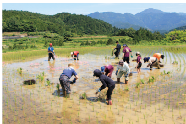
手際よく植え付けをする組員

吉延営農組合は5月29日、長岡郡本山町吉延地区で毎年恒例の棚田アートの田植えが行われました。組員や本山町特産品ブランド化推進協議会、農業公社ら関係機関から約30人が参加し、4カ所の棚田で植え付けを行いました。 平成19年に設立した同組合では、棚田アートや散策ツアーなど農地保全や地域の活性化を目指した幅広い活動を毎年実施し、昨年10月には農林水産省のむらづくり部門で農水大臣賞を受賞しました。 参加者は、「美しい景観をぜひ、多くの方に見に来てほしい」と話していました。7月頃には、見頃を迎えるそうです。