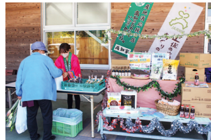
お楽しみ抽選会を行っています。