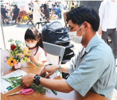
フラワーアレンジメントを楽しむ親子