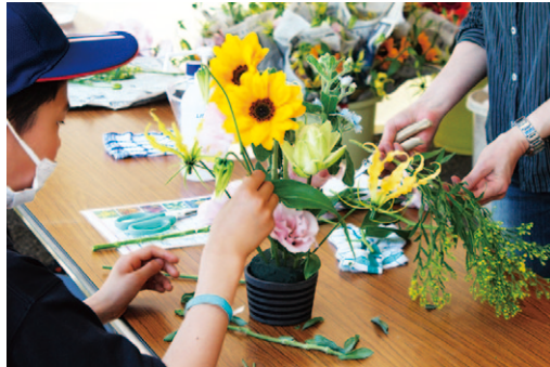
思い思いに花を挿していく子どもたち。完成品も十人十色です。