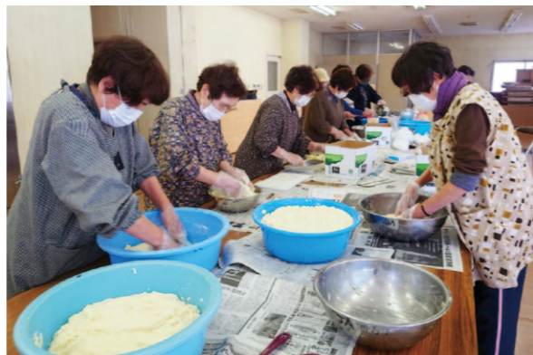
材料を混ぜ合わせています。

4月5日、JA高知県女性部四万十地区松葉川支部は、恒例のホウ酸団子作りを行い、9人が参加しました。ホウ酸団子はホウ酸、小麦粉、砂糖、牛乳、タマネギを混ぜて作るゴキブリ駆除に使用される毒エサです。今回はタマネギ約20kgを使用し、約160個のホウ酸団子を作りました。部員はマスクを着用し、コロナウィルス感染対策をとりながら、「タマネギが目にも染みる」「久しぶりに顔を見て良かった」など和気あいあいと作業に取り組みました。今後台所の隅などに置いて、ゴキブリの活動が盛んになる時期に備えます。