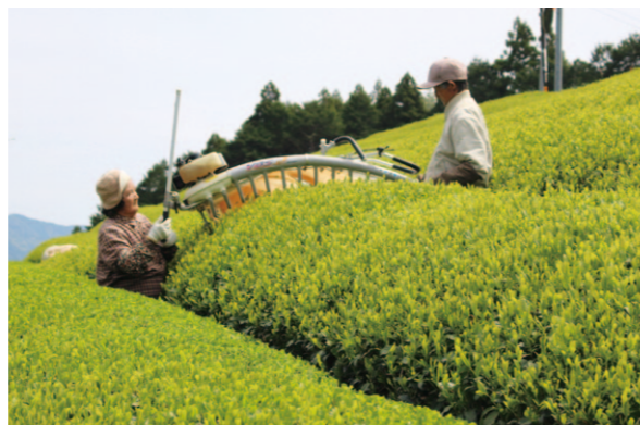
機械で丁寧に収穫していきます。

四万十川源流の町、津野町で新茶の収穫が始まりました。同町桂の茶園では、息の合った夫婦での収穫作業が行われており、高品質な茶葉が専用の機械で刈り取られ、収穫が行われています。津野山地域は標高が高く、昼夜の寒暖差が大きいため、収穫直前に降霜があり被害が心配されましたが、「防霜ファン」などで対策をとり大きな被害もなく、ひととき美しい新緑の茶畑が素晴らしい景観を生み出しています。1番茶の収穫が終わると親子茶から2番茶の順に収穫が行われていきます。