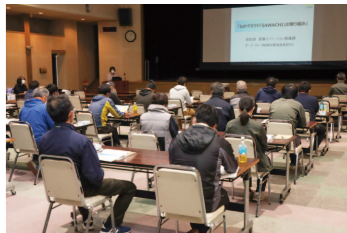
発表を聞く生産者ら。