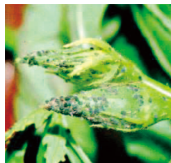
生長点部の吸汁加害