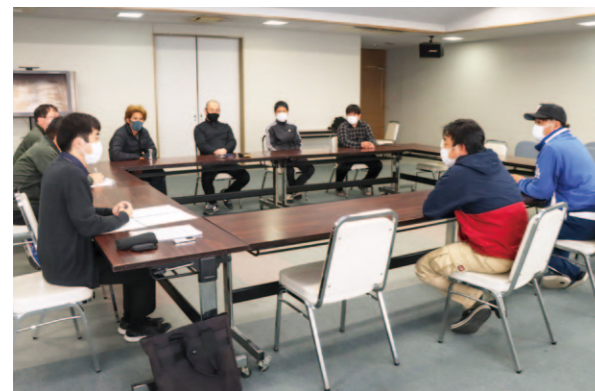
防除は6月から始まり、8月末まで続きます。

3月22日に野市支所2階でJAと無人ヘリオペレーターとの意見交換会が開催され、職員を合わせて9人が参加しました。これは、無人ヘリオペレーターがJAに対し、自分達の要望や提案を伝えたいという思いから企画。オペレーターからは、オペレーターの人員確保についてや、飛行する際の安全性について、無人ヘリ防除の担当職員の異動等があった場合についてなど、現状の課題について意見や提案がありました。JAはそれを踏まえ「オペレーターの補充をすすめ、安全をしっかり確保し、ドローンの外部委託をすすめたい」と話しました。