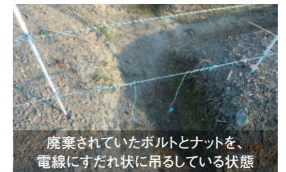
廃棄されていたボルトとナットを、電線にすだれ状に吊るしている状態