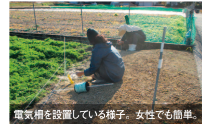
電気柵を設置している様子。女性でも簡単。

イノシシやハクビシンの被害でお困りの方、また、電気柵の設置に興味がある方は遠慮なくご連絡ください。