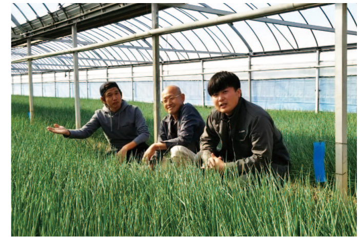
J A高知県のInstagramに投稿するPR動画を撮影しました。みなさんご覧ください