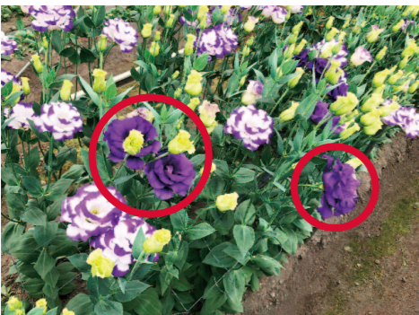
覆輪系の品種に発生した色流れ 20℃付近で日較差が少ないと発生しやすい

夜温は14〜16℃を維持できるように加温すると日較差を10℃以上確保することが出来ます。なお、開花時期に十分な夜温がないと本来の花色とならず、色が悪くなります。12〜2月の曇雨天日で、日中の温度が上がらない日は、昼温が20℃になるまで加温しましょう。昼温と夜温の日較差を作ること、少しでも光合成ができるよう温度管理に努めると良いでしょう。