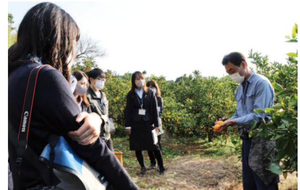
次回は土長地区で開催予定です

11月26日に、広報活動の充実を図ることを目的に、香美地区で各地区・各事業本部の広報担当者の研修会を開催しました。 研修会では、山北果樹集出荷場と山北みかんの園地、ルナビエナスイカのほ場を視察しました。山北みかんの選果・選別・箱詰めや生産者指導員から栽培のこだわりなどについて話を聞き、スイカのほ場では空中にぶら下がっているルナビエナスイカに驚きの声が聞かれました。 参加者は「各地区・地域によって栽培している農産物が異なり、大変勉強になった」と話しました。