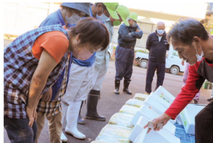
四方竹の規格を確認する生産者