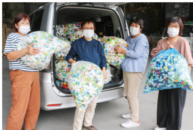
エコキャップを搬入する部員ら

南国市特産の秋のタケノコ「四方竹」の出荷が10月5日から始まりました。発祥の地といわれる同市白木谷、奈路地区の生産者でつくる四方竹生産組合は9日、目慣らし会を開き、生産者13人とJA担当職員等、関係者が参加。出荷規格などの確認を行いました。 同組合では、14戸が約11ヘクタールで栽培しており、昨年度は、9034ケースを出荷。成長に勢いのある10月上旬は、Lサイズの収穫が多く、同日は259ケース（1ケース4キロ） 計1036キロを出荷。作業は11月中旬まで続き、県内の他、関東や関西に出荷されます。長曾我部良親組合長は、「8月に多く雨が降ったので、湿り気があり状態も良い。全体の出荷量は昨年より増えるのではないかと話しました。 収穫した四方竹はその日のうちに加工を行い、氷を詰めて出荷されます。しゃきしゃきとした食感を残すため、ゆで加減にもこだわっており、煮物や天ぷらにして食べるのがオススメです。