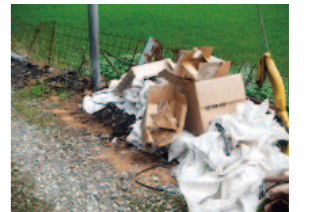
廃棄物放置の様子→

空きの肥料袋、使用済みビニール、廃ポリなどの保管場所は分けて保管しましょう。廃棄物の放置や野焼きは周囲に悪影響が生じるので、JAの回収日に廃棄するようにしましょう。