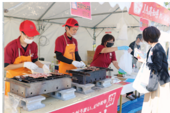
大盛況に終わったイベント（高知市中央公園）

JA高知れいほく地区とれいほく農経済センターは、10月23、24日、高知市で開かれた「土佐の豊穰祭2021」に出店しました。 イベントは中央公園、とさのさとの2会場で開かれました。とさのさと会場では土佐あかうし牛串、高知市会場では牛串とユズ加工品を販売。ユズ加工品には、手作りのポップを一枚一枚作成し、嶺北産ユズのPRも積極的に行いました。 2日間わたって開かれたイベントでは、県内のご当地グルメを味わおうと訪れた来店客で賑わいました。2日間で1385本の牛串を販売。大盛況のイベントとなりました。