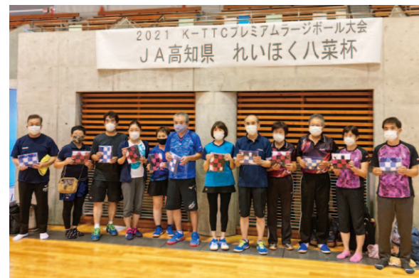
約60人が参加したラージボール卓球大会

10月1日（金）、JA高知れいほく園芸部協賛による、ラージボール卓球大会「JA高知れいほく八菜杯」が、いの町の天王青少年体育館で開かれました。大会には、県内外から約60人が参加し、汗を流しました。 休憩時間には同JAの営農指導員が、れいほく八菜の紹介を行い、参加者全員に米ナスを配布し、PRを行いました。また、大会の中で行われた抽選会では、「れいほく八菜セット」を景品として提供。当選した競技者は喜んで持ち帰りました。