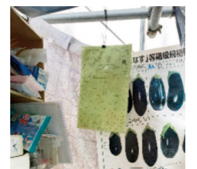
目につきやすい場所に置いておく ↓