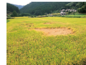
<トビイロウンカ> 坪枯れ症状