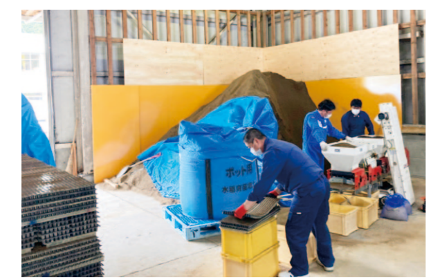
播種作業を行う生産者

4月に入り本年作の水稻育苗事業が本格的に開始され、れいほく管内にあるJA育苗施設においても、水稻もみの播種作業が行われました。この作業は、芽出しされたもみ種を専用の播種機械を使用し、苗箱に播種をする作業で、本年度、JA育苗センターも1か月間で約9万枚の育苗箱へ初の播種を行う予定です。 作業に訪れた生産者は、播種したたたくさんの苗箱をトラックに積み込み、豊作を祈願し持ち帰りました。