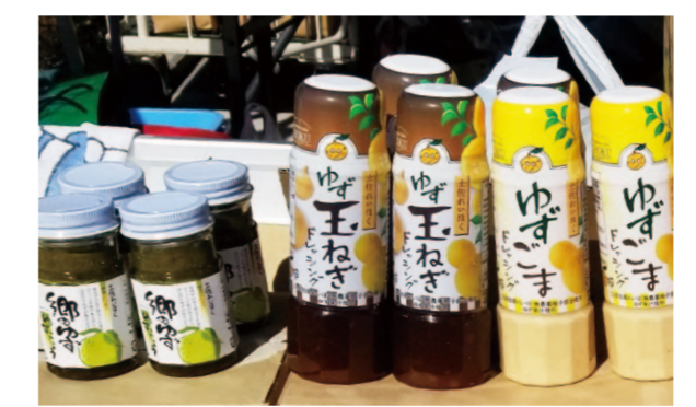
イベントで牛串販売を行う様子

JA高知県れいほく地区は、4月10日、11日の2日間、高知市にある「JAファーマーズマーケットとさのさ」で開かれた「とさのさと感謝祭」に参加しました。とさのさとオープン2周年を記念して開かれた同イベントでは、JA女性部や青壮年部の他、県内各地から計12の団体が出店。特設会場にて地元野菜や加工品などの販売を行いました。 れいほく地区は、土佐あかうし牛串と、ユズ加工品を販売。消毒などの感染防止対策を十分に行い、販売・PRを行いました。 イベントに参加した職員は、「コロナ禍でお客様の来場が心配されたが、たくさんの方が来てくれて良かった」と話し、イベントの盛況を喜びました。