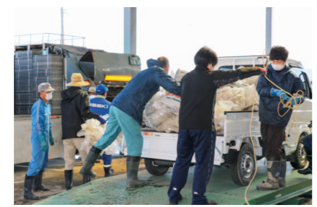
回収作業を行うJA職員

南国営農経済センターは4月14日、廃棄ポリフィルムの回収作業を行いました。当日は、生産者が使用後のハウス被覆用ビニールやシルバーマルチ、肥料の空き袋、育苗箱などが83件、合計6936kgを回収しました。回収後は種類別に細かく分別を行い、回収業者へ引き渡されます。今回の回収作業は6月上旬に行われる予定です。