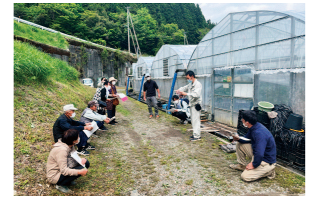
現地検討会の様子

れいほく園芸部米ナス部会は、4月30日に同管内石原地区にて、現地検討会を開催しました。当日は8人の生産者が参加のもと、3月に定植された米ナス圃場内にて、生育状況の確認を行いました。 また、嶺北農業改良普及所職員より今後の栽培管理についての報告を受け、生産者より活発な質問もあり、情報交換が行われました。出荷は、5月から12月にかけて計画しています。