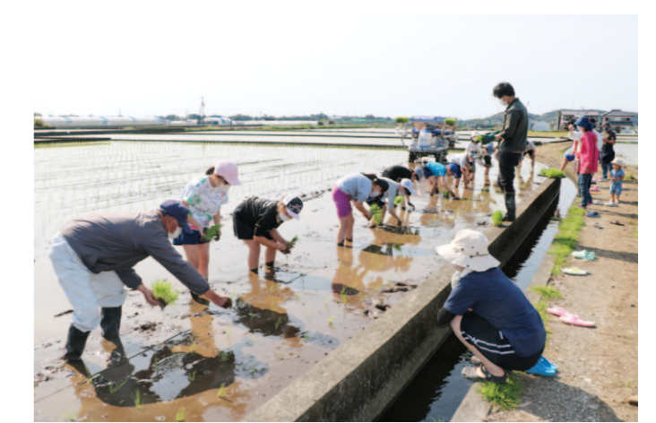
一列に並んで田植えを行う児童ら