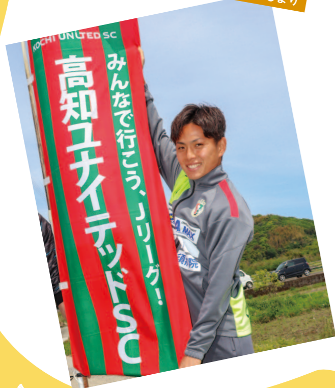
高知ユナイテッドSCより