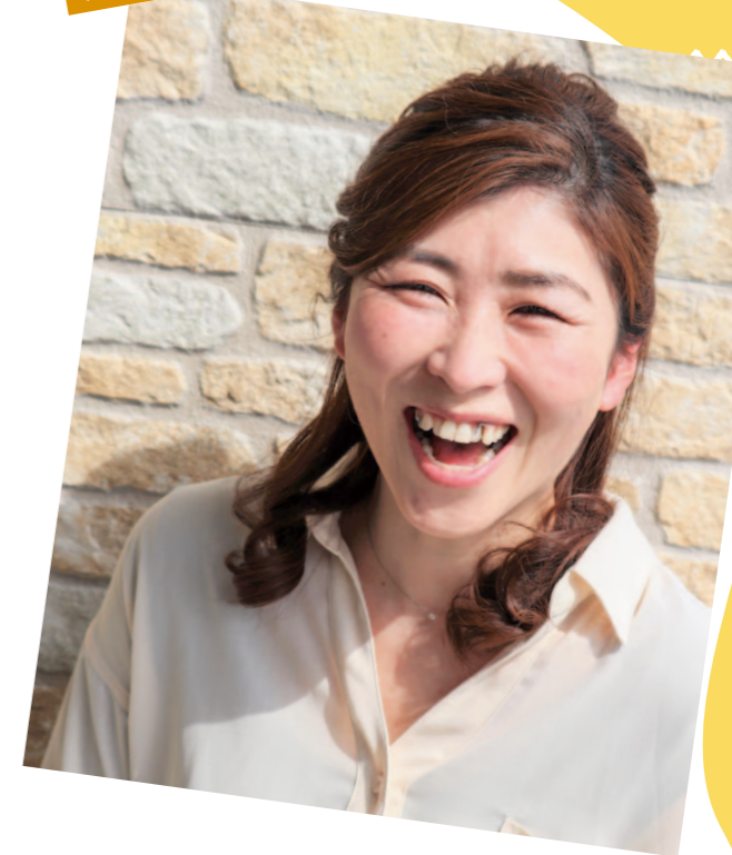
フレッシュミズ部会より

女性部の方々とも交流があり、お声がけいただいで活動に参加することもあります。子育てについてのアドバイスや、「この野菜はこう食べるのがオススメ!」と調理方法を教えてもらうこともあり、身近に頼れる方々がいてくださることにとっても感謝しています。こうして「人」と向き合い交流できる場所があるということは、とても大切に素敵なことだなぁと感じています。