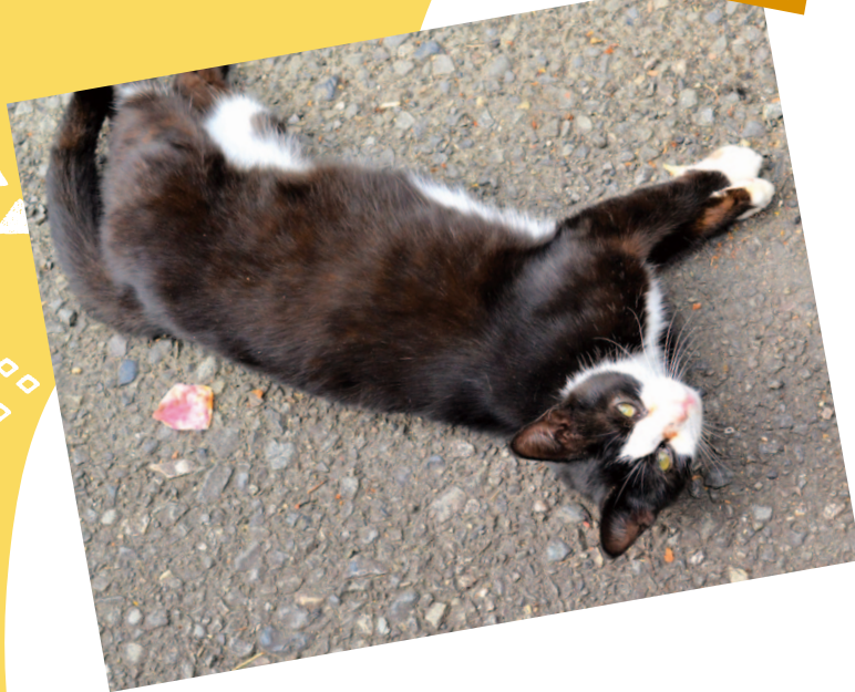
中村支所管内より

ご近所さんの野良猫たちとも仲が良く、一緒に遊んでいるところもしばしば見かけます。ちょっと身体が弱いとのことですが、大きな病気にかかることもなく、このまま元気に大きくなって欲しいです!!