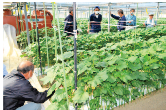
栽培方法等について議論する参加者ら

大方支所オクラ部会は3月3日、 黒潮町で今年初めての現地検討会 を開きました。同部会員や関係者ら 17人が参加し、収穫期を目前に控え たオクラの生育状況や病害の有無 栽培管理の見直しを行いました。 令和3年度、同部会では18人 がおよそ370アールで作付けを 行っています。現段階での生育状況 は良好。幡多農業振興センターは 「激しい寒暖差や灌水管理などの要 因が上手く噛み合い、例年に比べ早 い成長を見せている」と説明し、 「肥料の成分配合、炭酸ガスを効率 的に用いて更なる成長促進を」と参 加者に促しました。