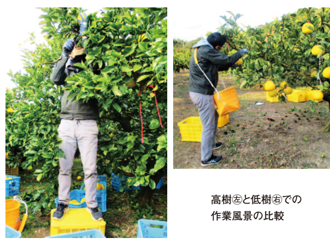
高樹⑤と低樹⑥での作業風景の比較

また、左記の表-1、表-2からも分かるように、低樹高では ①作業時間が7割に減少した ②収量は地域標準（3t/10アール）を上回った ③果実品質の低下は見られない という事実も明らかになっています。