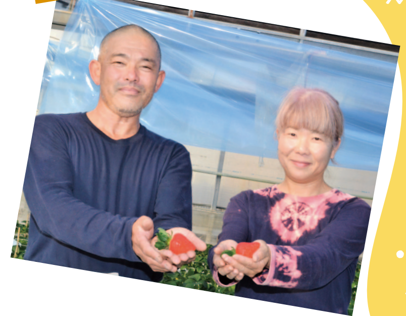
大方支所管内より

大粒で甘くて美味しいイチゴを、貴方の大切な人への贈り物にしてみたいはかがですか?