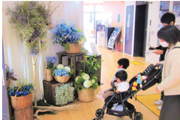
装飾の前で足を止める来館者

土佐清水市三崎の県立足摺海 洋館「SATOMI」で2月 11日、黒潮町で生産されたカス ミノウを始めとする鮮やかな装飾が お披露目されました。 JAグループ高知と高知県で 構成する県園芸品販売拡大協議 会が、新型コロナウイルスの影響 で消費が低迷する県産花を盛 り上げ、販売拡大に繋げようと 実施したものです。来館者らは 展示された装飾の前で足を止 め、色鮮やかな花々が魅せる癒 しの空間を堪能していました。