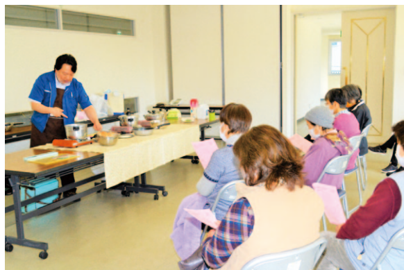
説明を受けながら調理を見学する参加者ら

女性部幡多地区西土佐支部 は2月25日、毎年恒例となつて いるムスイ鍋を使ったおもてな し料理実演会を西土佐支所で 開きました。 ムスイ鍋を使った簡単お赤飯 やふわふわポテトサラダの作り 方を実演していただいたのは、 ㈱HALMUISYさん。参加した 部員らは「お鍋やフライパン一 つで作ることが出来る色々な料 理を知ることができて、とても 参考になる実演会で有意義だっ た」と、短時間でできて手間い らずながらも美味しい料理を 楽しみました。