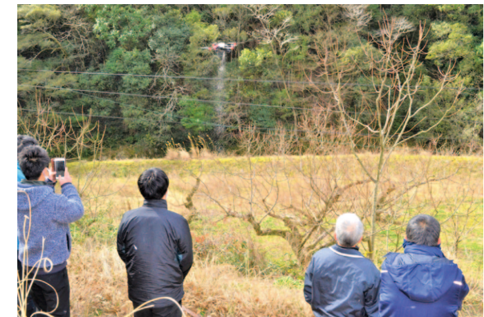
栗の木へ肥料を散布するドローン

女性部幡多地区十和支部は2月8 日、手作り万華鏡教室を開きました。 同教室では、部員ら10人が万華鏡 の制作にチャレンジ。厚紙や反射 板を組み合わせた万華鏡の筒部 分を作り、中身の装飾には色付きク リップ、色紙を細かく切ったものや カラフルなビーズを使うなど思い思 いの万華鏡に仕上げました。参加者 らは出来上がった自信作の万華鏡を お互いに見せ合い、「作った人によ って見える柄が全然違っていて個 性が出ている。とても楽しく作るこ とが出来た」と、終始賑やかに楽し みました。