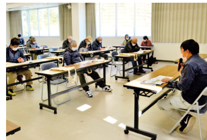
新品種について説明を受ける生産者ら

大方支所オクラ部会は3月3日、 黒潮町で今年初めての現地検討会 を開きました。同部会員や関係者ら 17人が参加し、収穫期を目前に控え たオクラの生育状況や病害の有無 栽培管理の見直しを行いました。 令和3年度、同部会では18人 がおよそ370アールで作付けを 行っています。現段階での生育状況 は良好。幡多農業振興センターは 「激しい寒暖差や灌水管理などの要 因が上手く噛み合い、例年に比べ早 い成長を見せている」と説明し、 「肥料の成分配合、炭酸ガスを効率 的に用いて更なる成長促進を」と参 加者に促しました。