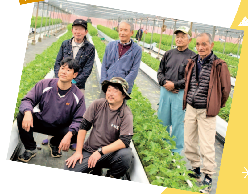
中村支所管内より

HPの力を借りて売り上げ向上に繋げ、これから益々美味しい大葉を作れるよう部員一同精進していきます!