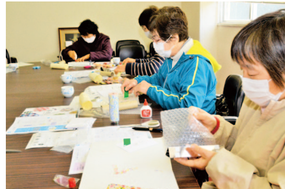
慎重に作業を進める参加者ら

女性部幡多地区十和支部は2月8 日、手作り万華鏡教室を開きました。 同教室では、部員ら10人が万華鏡 の制作にチャレンジ。厚紙や反射 板を組み合わせた万華鏡の筒部 分を作り、中身の装飾には色付きク リップ、色紙を細かく切ったものや カラフルなビーズを使うなど思い思 いの万華鏡に仕上げました。参加者 らは出来上がった自信作の万華鏡を お互いに見せ合い、「作った人によ って見える柄が全然違っていて個 性が出ている。とても楽しく作るこ とが出来た」と、終始賑やかに楽し みました。