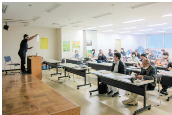
生産者は熱心に耳を傾けていました

2月26日、津野山営農経済センターで高知県立森林技術センターによる特用林産物の研修が開催され、主要品目であるシキミ・サカキの管理法や病害虫防除に関する講習会が行われました。特用林産物に関する講習は開催頻度も少ないため、生産者からは非常に勉強になると好評でした。現地講習は悪天候で次回へ見送りとなりましたが、今後も定期的に研修会を開き生産力向上を目指していきたいと考えています。