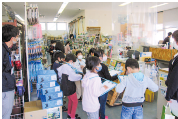
一生懸命聞き取りをしてくれました

3月3日、大野見支所で大野見小学校1、2年生の社会科授業が行われ、「いつもなかよしたんけんたい」の皆さんが信用共済窓口や購買店舗業務の見学を行いました。「どんな仕事をしていますか?」「どんなものがありますか?」など少し緊張気味でしたが、購買店舗では「おじいちゃんとか来たことがある!」と答えてくれたお子さんもいて、段々と元気な声が出るようになっていました。春の訪れとともに明るい笑顔があふれ、元気をもらったひと時でした。