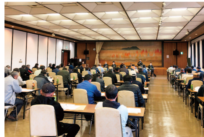
議案について審議が行われました