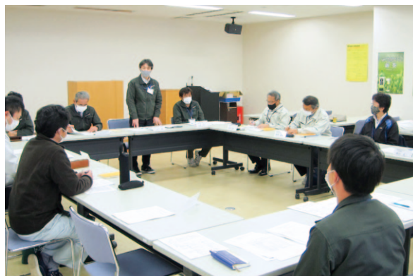
組織間で連携をとり計画を進めます

3月2日、津野山営農経済センターで「津野山地域連絡協議会」が開催されました。JA、県農業振興センター、津野町・梶原町役場の4組織間による管内の農業の維持・活性化に向け、令和2年度の実績を基にした次年度の計画について協議し、普及指導及び営農指導の取組み方針や行政支援等の計画が立てられました。管内の農家人口の著しい減少に歯止めをかけるため指導機関と行政が一体となり、地域農業を支えていきます。