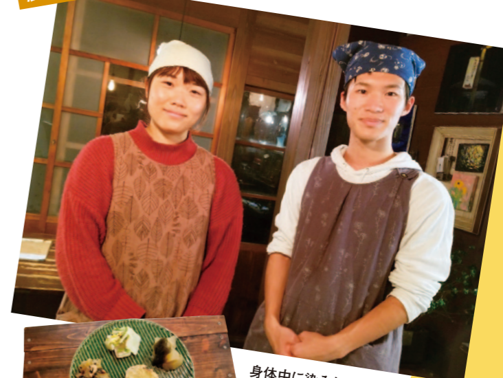
身体中に染みわたる優しいお味