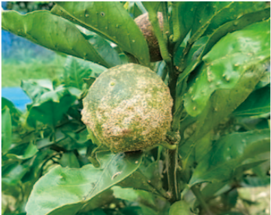
葉・果実上のいぼ状病斑