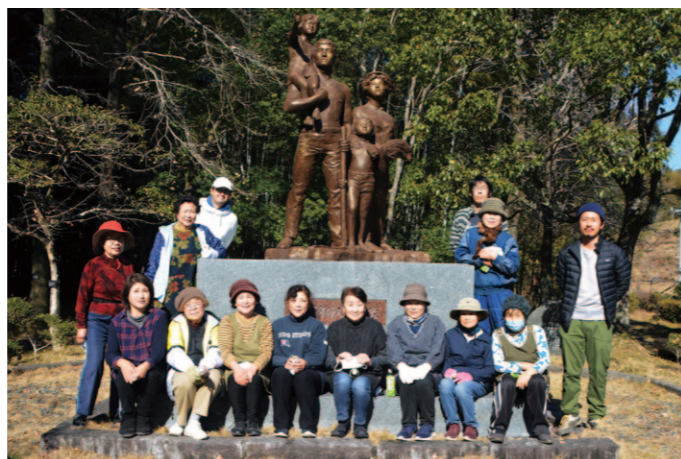
部員のおかげで美しい景観を取り戻しました

今回は2日間限定でしたが、好評であれば今後も季節限定で提供します。その際にはJA高知県公式のSNS等でお知らせいたしますので、お見逃しなく！