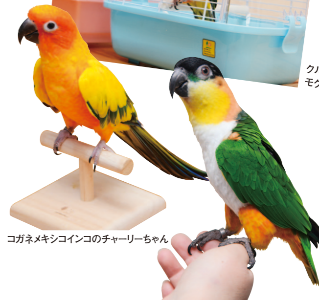
コガネメキシコインコのチャーリーちゃん