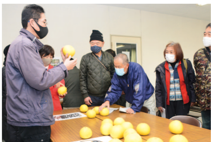
職員とともに基準を確認する部員ら

調理実習では、香美市の健康課題である「高血圧」について学習するため、「具だくさんみそ汁」の塩分濃度をはかり、0.7%と薄味になるように調整。女性部員が用意した同じ塩分濃度の、具が少ないみそ汁と飲み比べを行いました。生徒らは「普段飲んでいるみそ汁がどれだけ濃いかというのが分かった。今度、家でも野菜たっぷりのみそ汁を作ってみる」と話し、学びが今後につながる有意義な調理実習となりました。