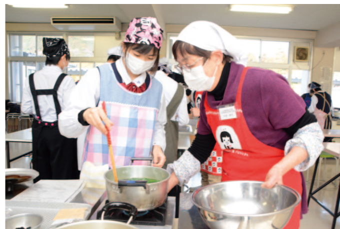
ネギはゆがき過ぎないように、色の変化を見ながらやったらいいよ！

女性部土佐香美地区は1月28日、香北中学校の2年生14人を対象に、地場産物を使った料理教室を実施しました。今回は管内でとれた食材で「ブリのゆずみそ焼き・ブロッコリー添え」「やつこねぎとおじゃこのマヨネーズ和え」「具だくさんみそ汁」「けんかもち」を調理。使用するみそは、毎年大宮小学校の4年生が女性部の指導のもと「みそ作り体験」を実施し、作ったもの。香北中学校の生徒も小学生の時に体験しています。