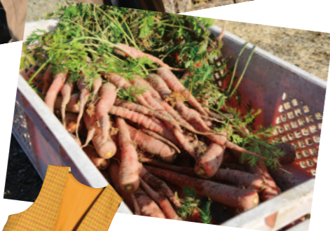
畑で採れたニンジンたち