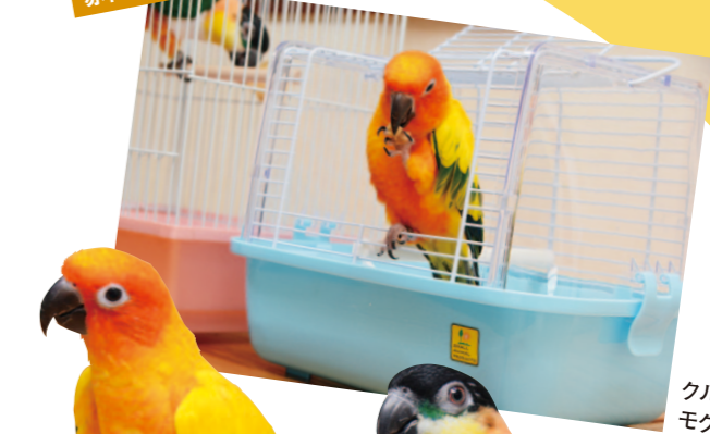
クルミをモグモグ