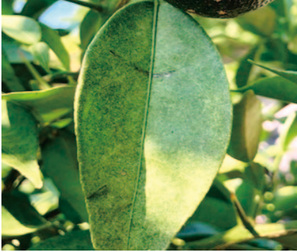
ハダニに吸汁された葉

春葉での発生を抑えるために、剪定時に発病葉枝を除去することが有効です。また、展葉初期(もつとも伸びた春芽が1cm程度)と落果始めに薬剤散布を行います。テランフロアブル(1000倍・30日・3回)が有効ですが、肌等にかぶれが起る方はフルーツセイバー(2000倍・前日・3回)を使用してください。