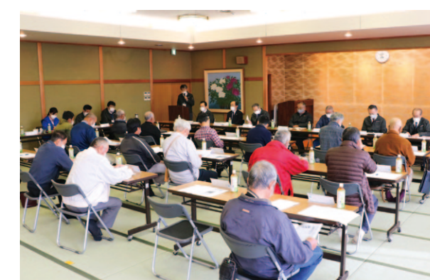
長岡支所の運営委員会の様子

土長地区では12月1日～9日にかけて支所別運営委員会を、れいほく地区5支所で2日間、南国地区8支所で4日間、開催しました。 会では、令和2年度決算の結果や総代候補者・各運営委員の選出、役員改選にむけた対応、米の不適切な取扱いについて協議・報告され、運営委員からの質疑に答えました。 特に米の不適切な取り扱いについては、厳しいご意見をいただき、本部へ報告いたしました。