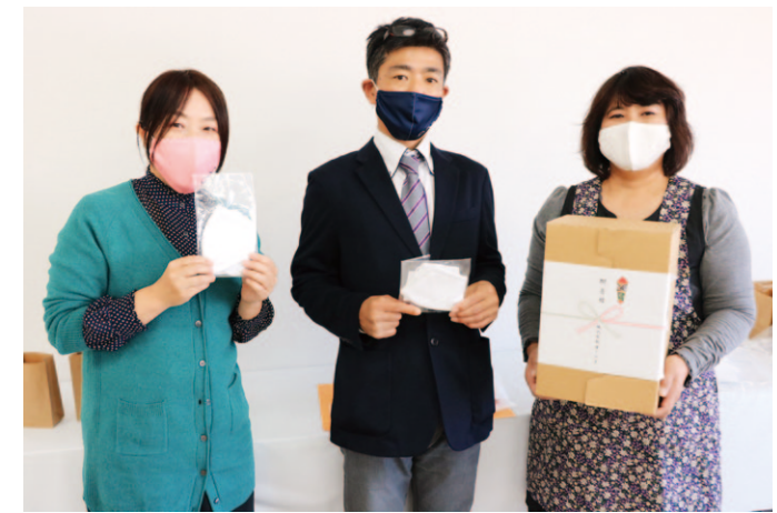
マスクを受け取った窪田支部長（右）