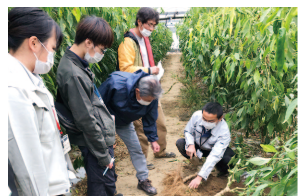
ハウス内で説明を受ける生産者たち

11月30日、れいほく園芸部土佐甘とう生産者は、現地検討会及び反省会を開催しました。現地検討会では、ほ場を巡回しながら株を引き抜き、かん水量の違いによる根量の違いを比較しました。夏場のかん水量が多かったほ場は、根量が多く収量も伸びており、改めて少量多回数のかん水を指導しました。令和2年度は生産者9戸、面積88・5アールの栽培計画で、総収量約37t(11月末時点、前年比185%となりました)。 令和3年度は3戸の生産者増加を予定しており、さらなる収量増を目指し、部会活動に力を入れていきます。